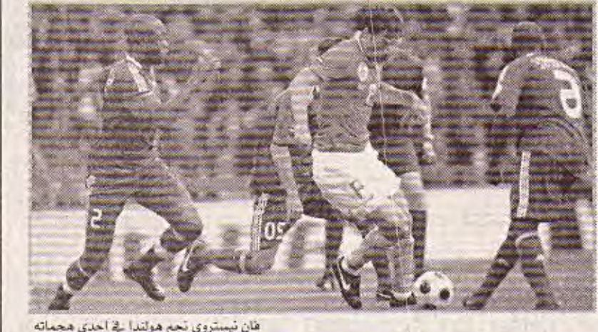
فان نيشوري نجم هولندا في إحدى هجماته