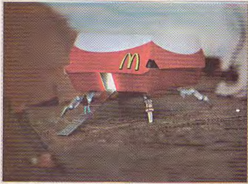
أحد الأعمال الفنية داخل معرض الفن الحضري في مدينة دبي بلندن