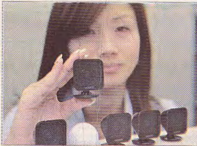
امدتك اليابانيات تعرضن جهازاً صوتياً جديداً لصوتها بحجم كرة الشونفا