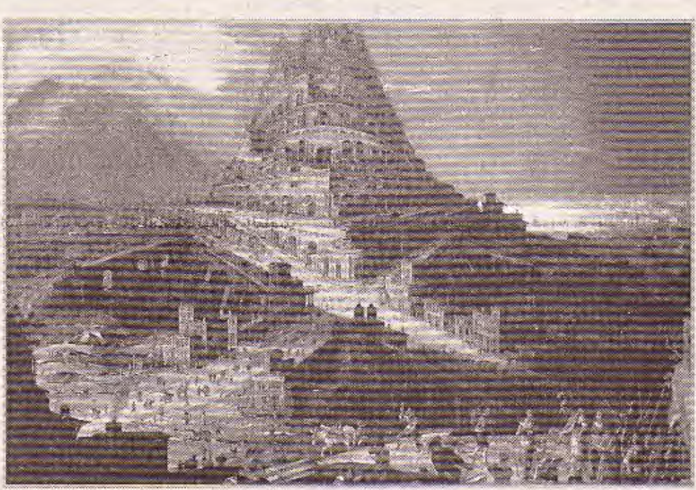
من الفلكلور العالمي