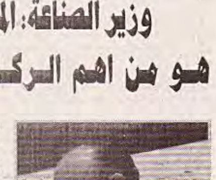
بغداد / الهدفا

وأضاف ان التوجه بالانفتاح نحو القطاع الخاص والاستثمار ودعم المشاريع الصغيرة والمتوسطة يعد دانه عامل أساسي وفعال لتنمية اقتصاد اي دولة وهذا احد الأسس التي بنت الحكومة العراقية عليها سياستها الاقتصادية إضافة الى عودة العراق بقوة الى موقعه العربي من خلال وجوده في مثل هذه المنظمات.