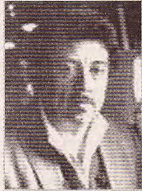
ترجمة وإعداد: المدى

ولد الشاعر والروائي مانليو أргуيتا (Manlio Argueta) في سان ميغويل، في السلفادور، في عام 1936. وهو من بين أدبي مؤلف من مثقفين متميزين تأثروا ببطان يوليوس سارتر، وكانت لهم دورهم الفاعل في نقل الثقافة الوجودية إلى أمريكا الوسطى. وقد اهتم في رواياته المعاصرة التساؤل الفلسفي عن قوة البشر. وترقى الأسئلة المحددة في أعماله الشخصية إزاء قضايا الحرية، والمساواة، والتحرر، والمسؤولية. إنها مستوحاة التطبيق العملي. وقد أصدر العديد من الأعمال الأدبية، مثل (مكاتب يدعى ميلاغو وفي لا باز)، و (أين ضيول البحر الجنوبي)، و (يوم واحد من الحياة)، و (من جوائز عديدة، وتُرجمت بعض أعماله إلى أكثر من 12 لغة). وكان رواية (يوم واحد من الحياة)، التي هُتفت فيها السلفادور خلال الحرب الأهلية، قد صُنفتها (الكتبة الحديثة) الخاصة في قائمة أفضل مئة رواية أمريكية لاتينية في القرن العشرين. ونشرها جانباً من المقابلة التي أجراها مع كوكيا م. سليمان أرياس لمجلة (Ciber Traces).