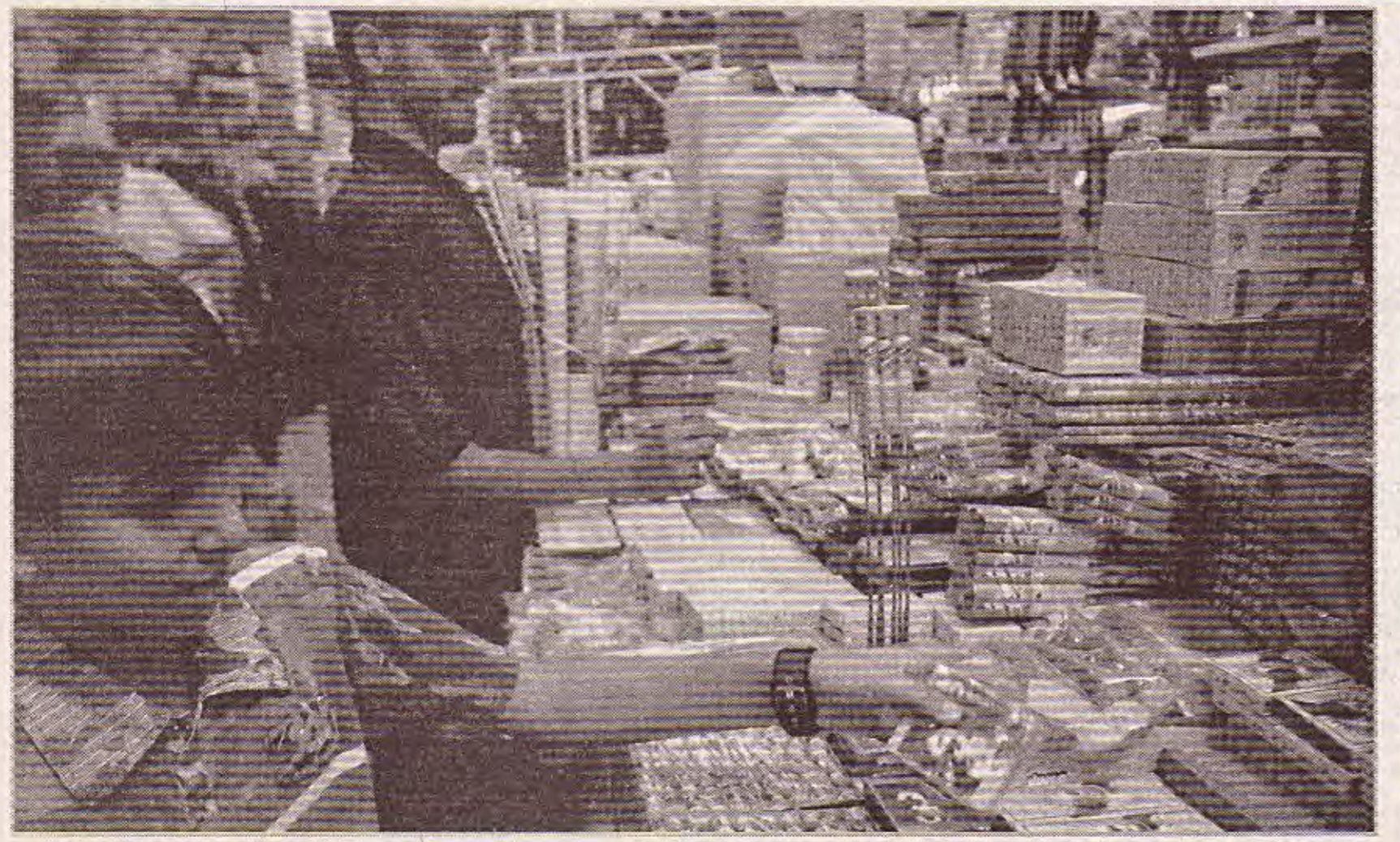
مع بداية العطلة الصيفية.. رواج للعب الأطفال