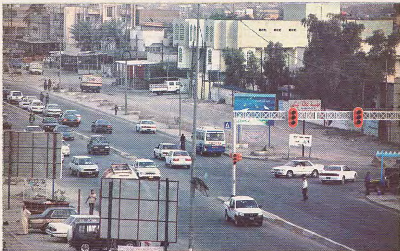
عودة الأمن إلى شوارع البصرة بعد عملية صولة الفرسان / عسمة سعد الله الخالدي

بغداد / المصفاة يجري رئيس الجمهورية جلال طالباني سلسلة من اللقاءات مع المسؤولين في واشنطن التي وصلها في وقت سابق بعد ان انهي الفحوصات الطبية التي أجراها في مستشفى مايوكلينك بمدينة راجستر الأمريكية. وكان طالباني قد التقى رئيس مجلس الأمن خلال دورته الحالية السفير الأمريكي في الأمم المتحدة زلمي خليلزاد، حيث بحث الجانبان القضايا التي تتعلق بالوضع في العراق، ومنها المساعي المبذولة لإخراج العراق من الفصل السابع. ومن المقرر ان يغادر رئيس الجمهورية الولايات المتحدة نهاية حزيران الجاري متوجهاً الى اثينا للمشاركة في مؤتمر الاشتراكية الدولية. من جانب آخر أكد طالباني ان العراق دولة مستقلة لا يمكن تجاهل دورها التاريخي والحضاري، وأضاف في حوار أجرته قناة (الفيحاء) الفضائية اشار فيه الى عدد من القضايا المهمة التي تتعلق بالمسيرة السياسية