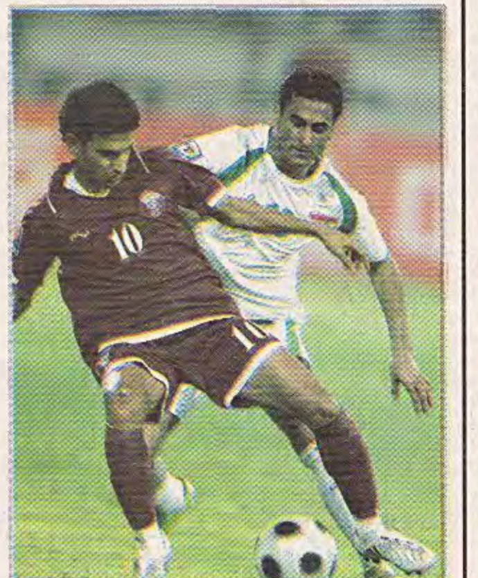
صبيان الفؤك / دبيها موقف الاتحاد العراقي للصحافة الرياضية

قرب ما يكون الى المصادفة منه التي التخطيط، كذلك فشل حمد بمعالجة الأخطاء الحاصلة ولم يتمكن من استخدام اوراقه المطلوب مما افقد التزام الضريق القطري وجعله تحت الخطر القطري الذي نجح باقتناص فرصة ذهبية كانت كفيلة بتحقيق الفوز وخسارة الضريق العراقي بالرغم من كل الظروف المثالية التي كانت مهيبة له وتلبس معه من ارض وجمهور رائع قل نظيره وفرصتي الفوز والتعادل فضلا عن التحكيم الذي كنا نخشى منه واذ به اقرب لنا من ان يكون علينا.