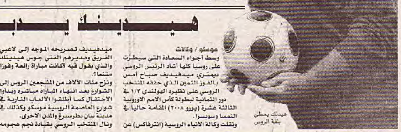
ميدلر يحظى بكرة الروس