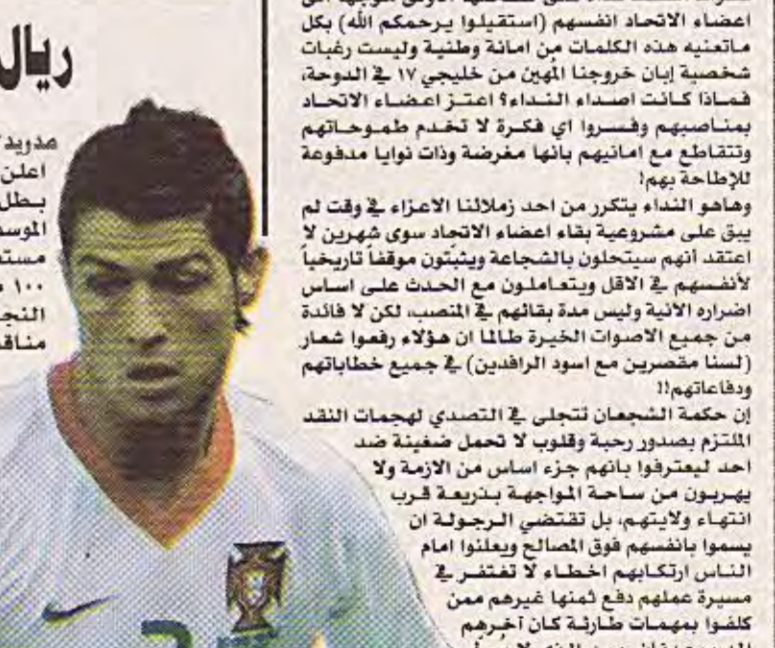
صبيان الفؤك / دبيها موقف الاتحاد العراقي للصحافة الرياضية

مدريد / وكالات اعلن رئيس نادي ريال مدريد الإسباني بطل دوري الامم لكرة القدم في الموسم الاخيرين رامون كالدرون انه غير مستعد لدفع مبلغ مقداره ١٠٠ مليون يورو لخدمات النجم البرتغالي كريستيانو رونالدو منافساً للكلام الذي قاله المدرب الالمانى بيرند شوستر.