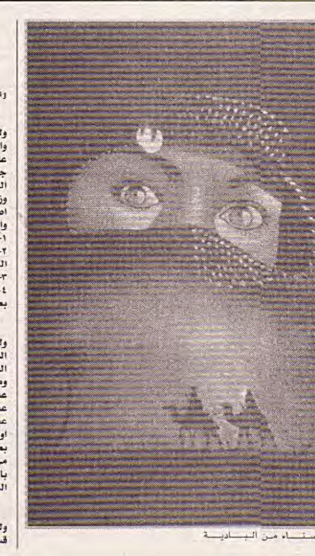
حمتاء من البادية