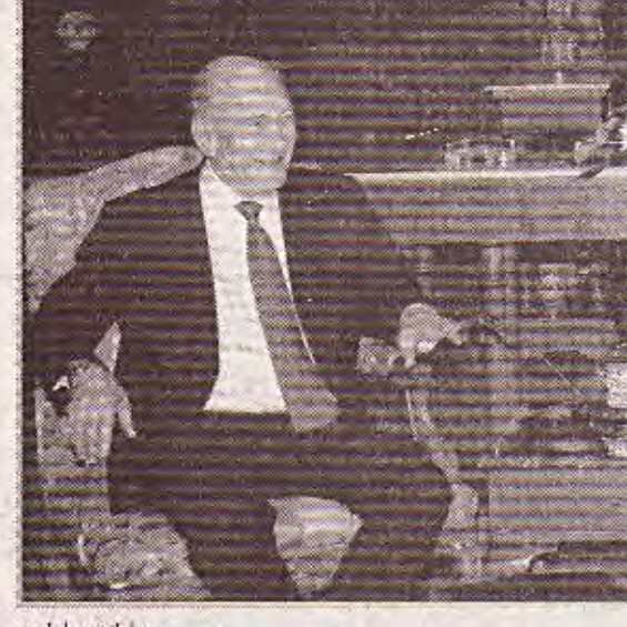
مبارك مع اولمرت

ولم تعلن اسرائيل رسميا موت الجنديين الداد ريفيف وايهود غولدواسر اللذين خطفهما حزب الله في تموز 2006 على الحدود مع لبنان. الى ذلك اعلن الجيش الاسرائيلي عن اطلاق قذيفة هاون ليل الاثنين الثلاثاء من قطاع غزة على اسرائيل بالرغم من التهدئة السارية لليوم السادس على التوالي. وقالت متحدثة عسكرية "بلغنا عن سقوط قذيفة هاون في الجانب الاسرائيلي من السياج الحدودي بين شمال قطاع غزة واسرائيل، مضيفة انه لم يسجل سقوط ضحايا. ويشكل اطلاق قذيفة الهاون اول خرق يعلن عنه للتهدئة التي دخلت حيز التنفيذ الخميس في قطاع غزة بين حركة حماس المسيطرة على القطاع واسرائيل. على صعيد اخر افتتح امس مؤتمر دولي في برلين لدعم فرض القانون