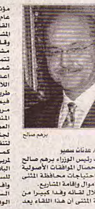
السماوة / بغداد سمير دعا نائب رئيس الوزراء برهم صالح إلى استكمال الموافقات الأصولية لتنفيذ احتياجات محافظة المني لرصد الاموال وإقامة المشاريع وقال خلال لقائه وفدا كبيرا من محافظة المني ان هذا اللقاء يعد

فيما دعا أعضاء الوفد إلى إنشاء مستشفى بسعة 400 سرير في السماوة ومستشفى بسعة 200 سرير في مستشفي آخر بسعة 100 سرير في الخضر فضلا عن إقامة مراكز صحية نموذجية وإنشاء مدينة العباب وفتح طرق داخلية في السماوة. كذلك عرض مدير الشرطة طلباته التي تمثلت بزيادة العجلات