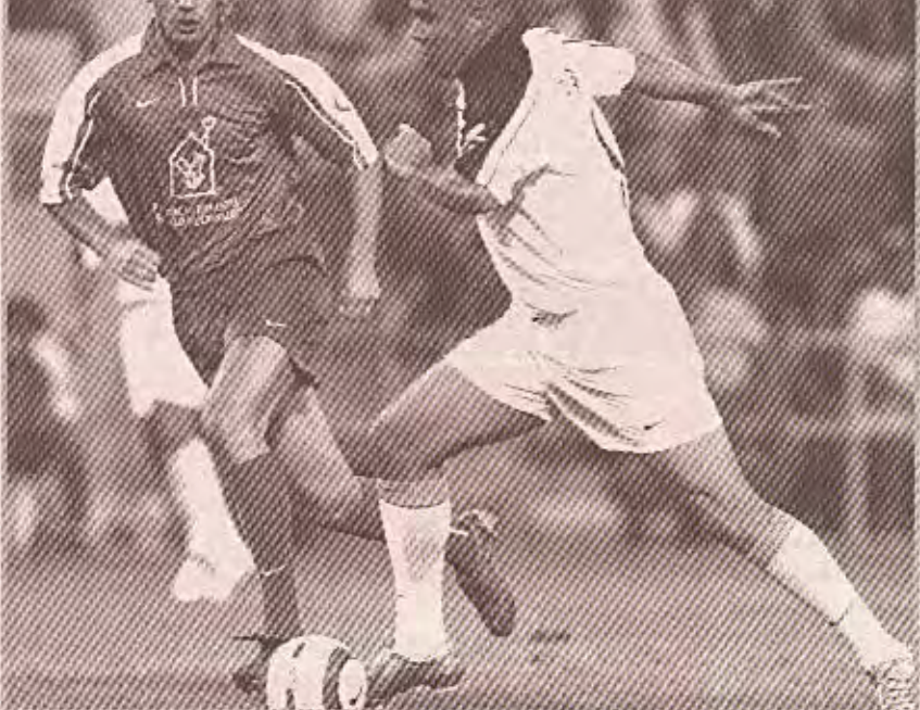
اللاعبون في مباراة ريال مدريد مع ملقة في الدوري الإسباني.

وكان ريال مدريد استهل الدوري المحلي بفوزه خارج أرضه على ملقة ١/٢، لكنه سقط على