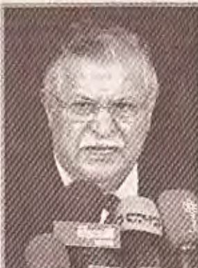
الولايات المتحدة / فاضا بالمدى كبر السيد رئيس الجمهورية جلال الطالباني ما صرح به قبل ايام من عدم وجود جدول لانسحاب القوات الاميركية ومتعددة الجنسيات من العراق، وعزا السبب الى ان جدولاً مثل هذا يساعد الارهابيين ويشجعهم على التفكير في ان باستطاعتهم هزيمة دولة عظمى في العالم وهزيمة الشعب العراقي.

العراق كاترينا، كنا في بغداد نغزي سوتانا لكننا لم ننس اصدقائنا. صلواتنا ومشاعرنا كانت مع اهالي ساحل الخليج، ونحن مرتبطون بمعاناتهم. وعندما سمعنا من حرمانهم من الماء والغذاء والحاجيات الاساسية الاخرى، عرفنا ماذا يعني ذلك، فلقد عانيتنا الشيء نفسه، لكن الفرق هو ان الموت والدمار في العراق كان من صنع البشر وليس من صنع الطبيعة. وأشار الطالباني الى الحيف والظلم الذي لحق بالعراقيين في عهد الدكتاتورية، بيد انه بمساعدة الحلفاء يقوم العراقيون بتغيير مجرى التاريخ للعراق العاصم من ماضٍ تميز بالصلف والوحشية وعدم الاستقرار الى ما نأمل ان يكون مستقبلاً ديمقراطياً. واضاف ان الرهابي القاعدة وايتام صدام لا يستطيعون مشاهدة عراق فيدرالي تعددي ديمقراطي، حيث الجميع متساوون في الحقوق ومحيمون في ظل القانون. وخاطب رئيس الجمهورية والحاضرين يانه لا الشعب العراقي ولا الشعب الاميركي بإمكانهما تحمل التخلي عن