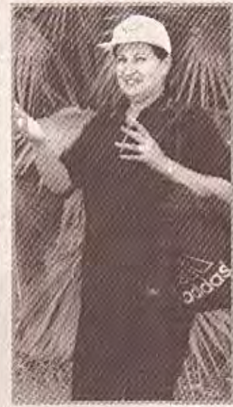
السوق في بطريقه (الدومينو)!!

اتذكر عندما استمرت نيران تصريحات النسوة مطلع هذا العام