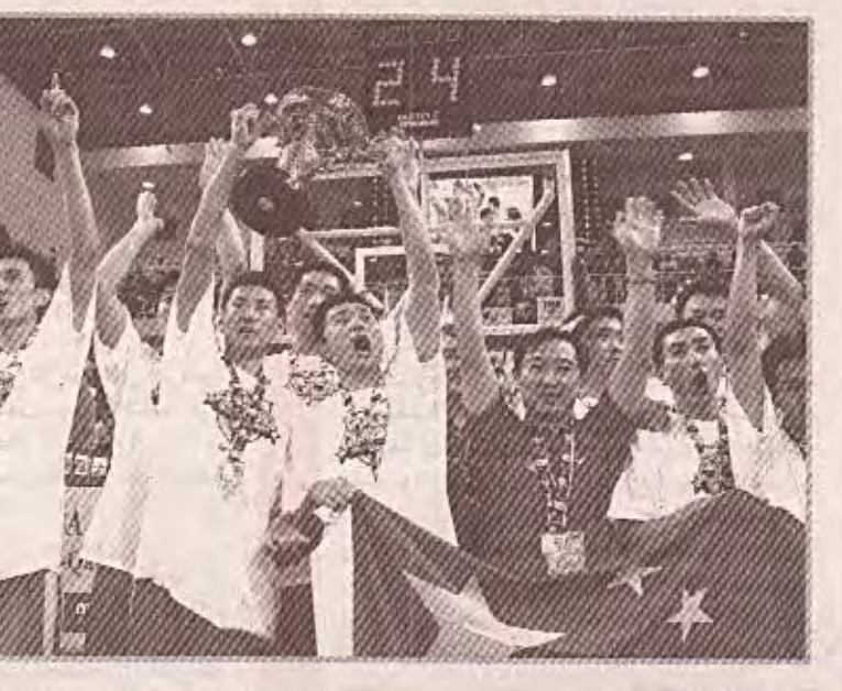
فنون اللعبة، بل واستطاعوا التزاع فوز ثمين من بين انياب الثمر الكوري للمرة الثانية في هذه البطولة.

واستطاع المنتخب الصيني ان يحافظ على لقب البطولة الآسيوية بعد فوزه في المباراة النهائية أمس ويفارق ١٦ نقطة ١١/٧٧ على المنتخب اللبناني الذي حل