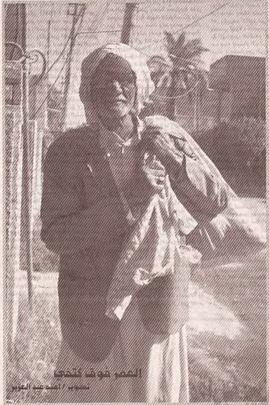
الوشم هو فن فن