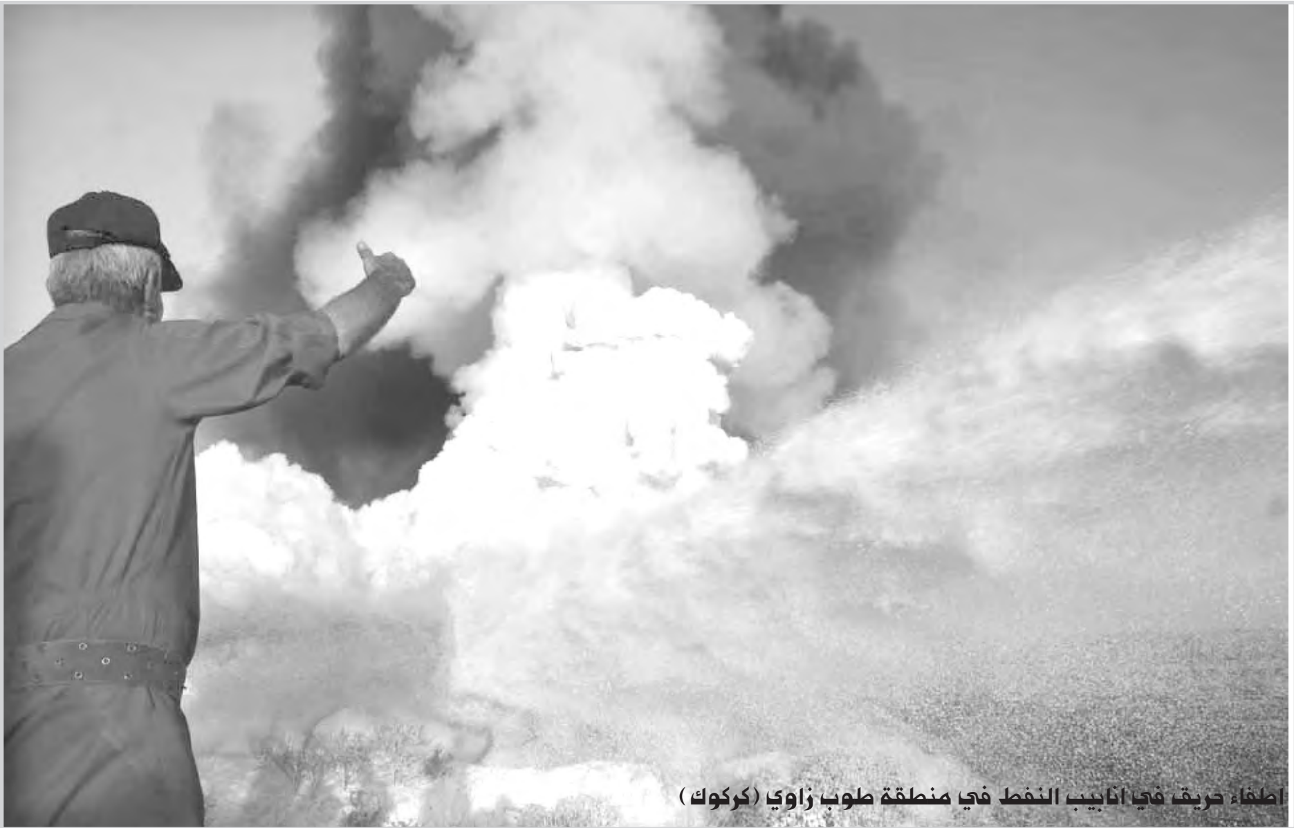
اطلاق دريق في انابيب النفط في منطقة طوب زاوي (كركوك)