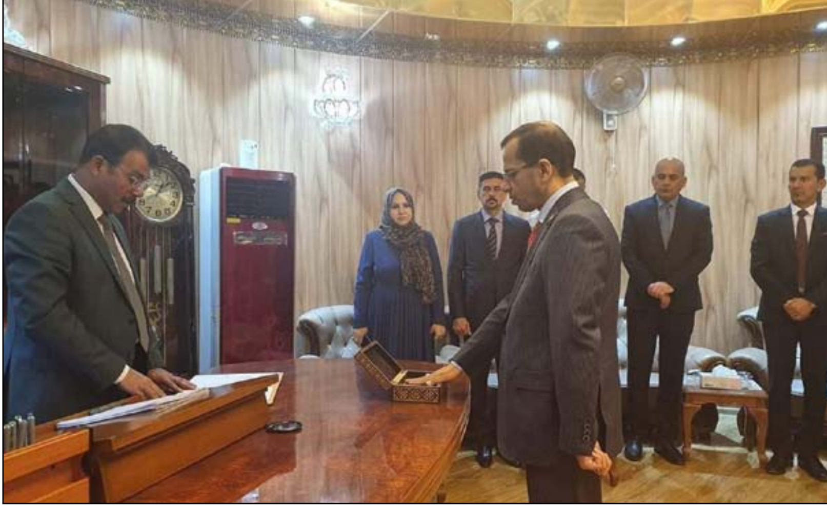
زهير الشعلان يؤدي القسم محافظا للديوانية .. ارشيف

مع اقتراب الانتخابات المحلية المقرر إجراؤها في نيسان المقبل، تشتد الصراعات على مناصب المحافظين، حيث شهد عام 2019 استبدال 5 محافظين، اثنين منهم في محافظة واحدة خلال شهرين. وتجري المنافسة في المحافظات بخارطة طريق مختلفة عن الخارطة السياسية الموجودة في مجلس النواب، إذ ان التحالفات البرلمانية تتفرق في بعض المحافظات ويقترب الخصوم في محافظات أخرى.