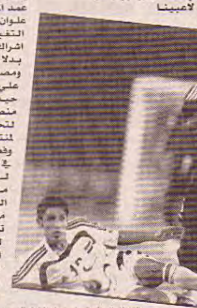
الخطا الدفاعية وراء خسارتنا امام الوحدة