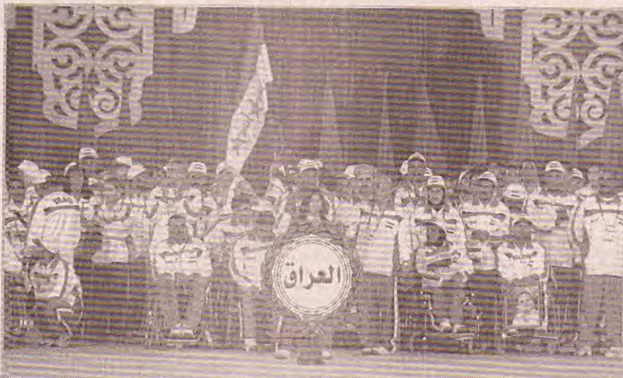
الوفد الرياضي العراقي لحظة دخوله عرض الافتتاح في استاد القاهرة الدولي

النجاح للدورة التي ستكون بمثابة الخيمة التي تجمع ابناء الامة العربية من المحيط الى الخليج. وجرى مراسم رفع علم الدورة حيث رفع المهندس حسن صقر رئيس اللجنة العليا المنظمة علم الدورة وسط تصفيق الجماهير التي غطت معظم مدرجات ملعب القاهرة ورده احد الرياضيين المصريين نيابة عن المشاركين قسم الدورة ليعلم بعدها الرئيس المصري افتتاح الدورة العربية الحادية عشرة بشكل رسمي.