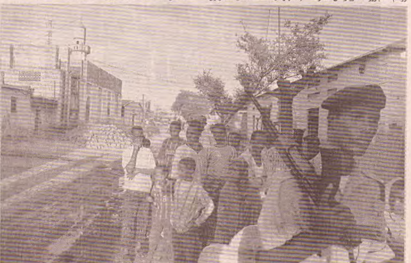
مقديشو / الوكالات