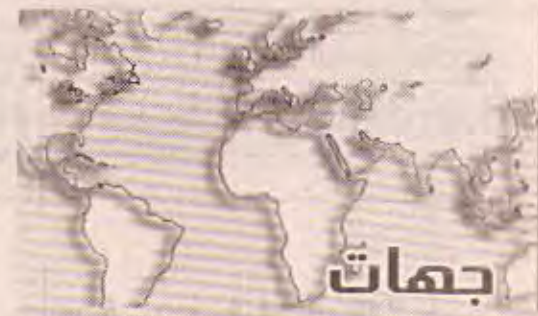
الصحف / وكالات

فناشد الامين العام لحزب الله السيد حسن نصر الله امس الاول الاحد الرئيس اللبناني اميل لحود القيام بخطوة انقاذية لصون البلاد من الانزلاق الى فراغ سياسي اذا عاجز الفرساء