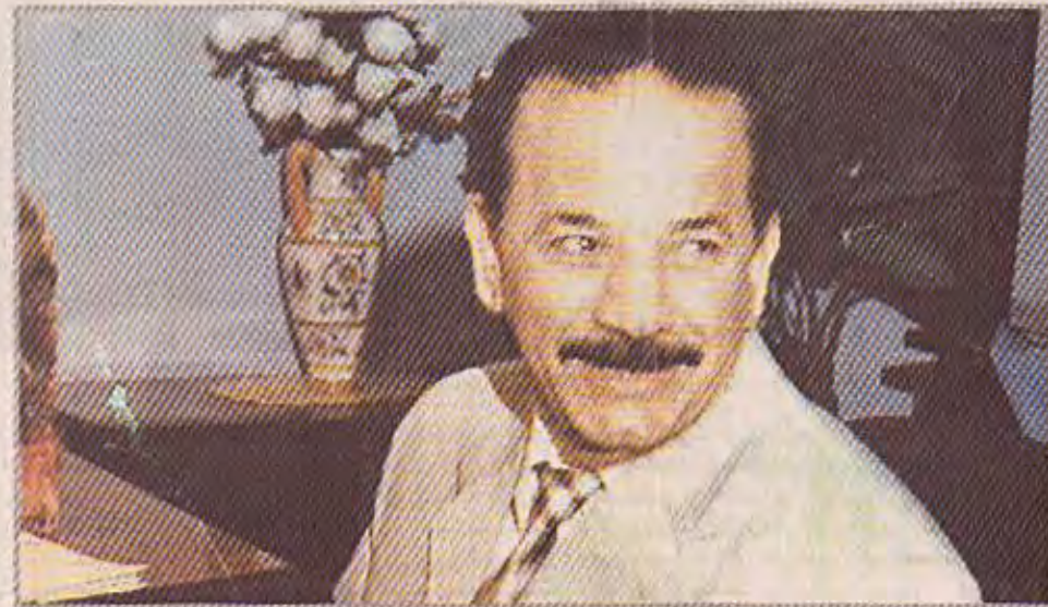
نظرة الدولة لفنان هل أثرت سلباً في عطائه؟

هذا القصور الكبير وهذه النظرة الضيقة أثرت سلباً في المبدع العراقي وأنا أريد كل من شخص هذه الحالة في وسائل الإعلام المختلفة والواجب أن تقف الدولة بكامل مؤسساتها مع الفنان وترعاه وتدعمه حتى يتواصل في العطاء ومع كل المعاناة نجد الفنان العراقي يواجه مصيرته الضيقة دون توقف برغم كل الصعوبات.