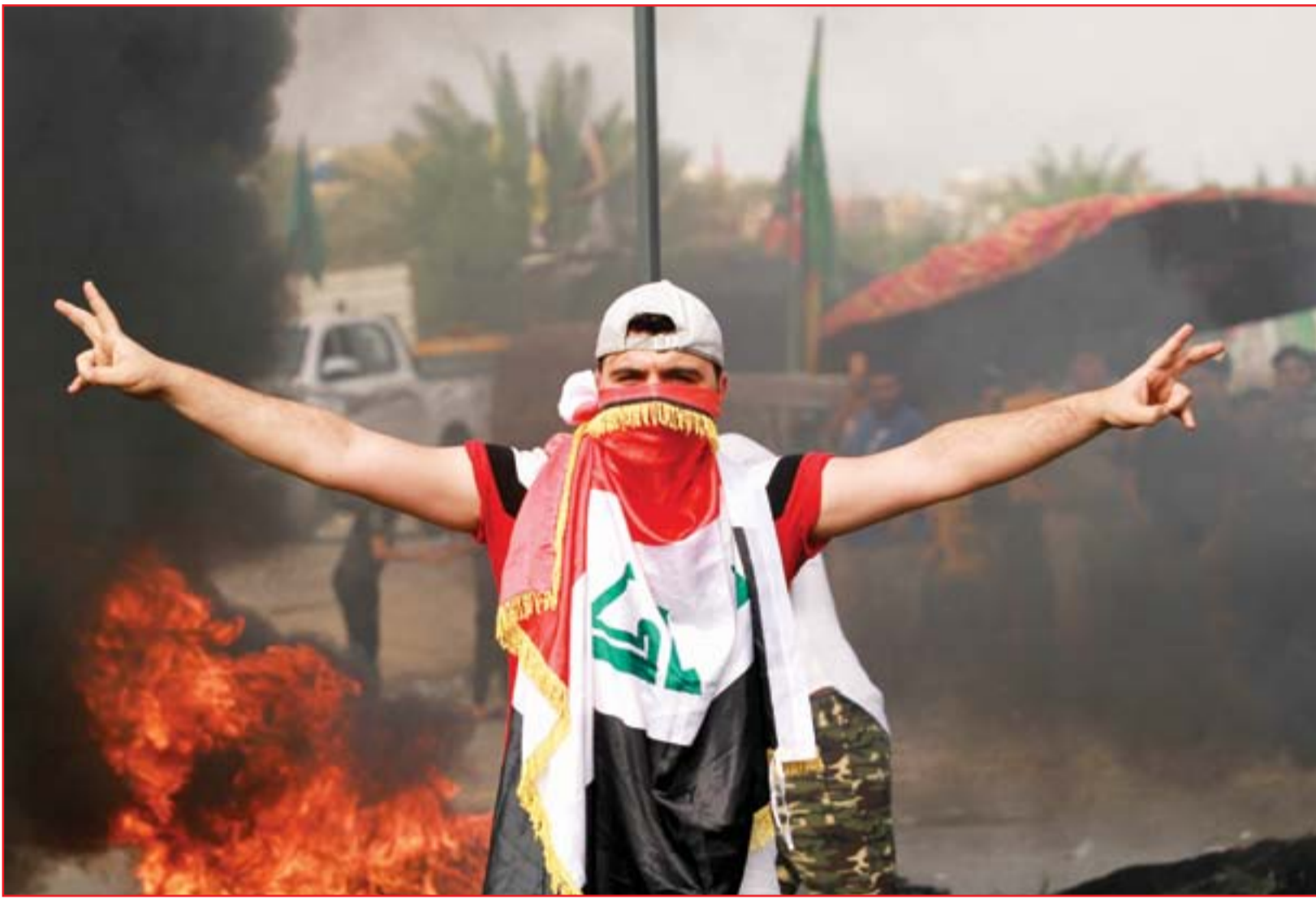
متظاهر يلوح بعلمة النصر في مدينة الصدر امس..

الأمم المتحدة قلقة.. وسفارة واشنطن تعرب عن أسفها.. والصدر: إسناد الاحتجاجات باعتصام