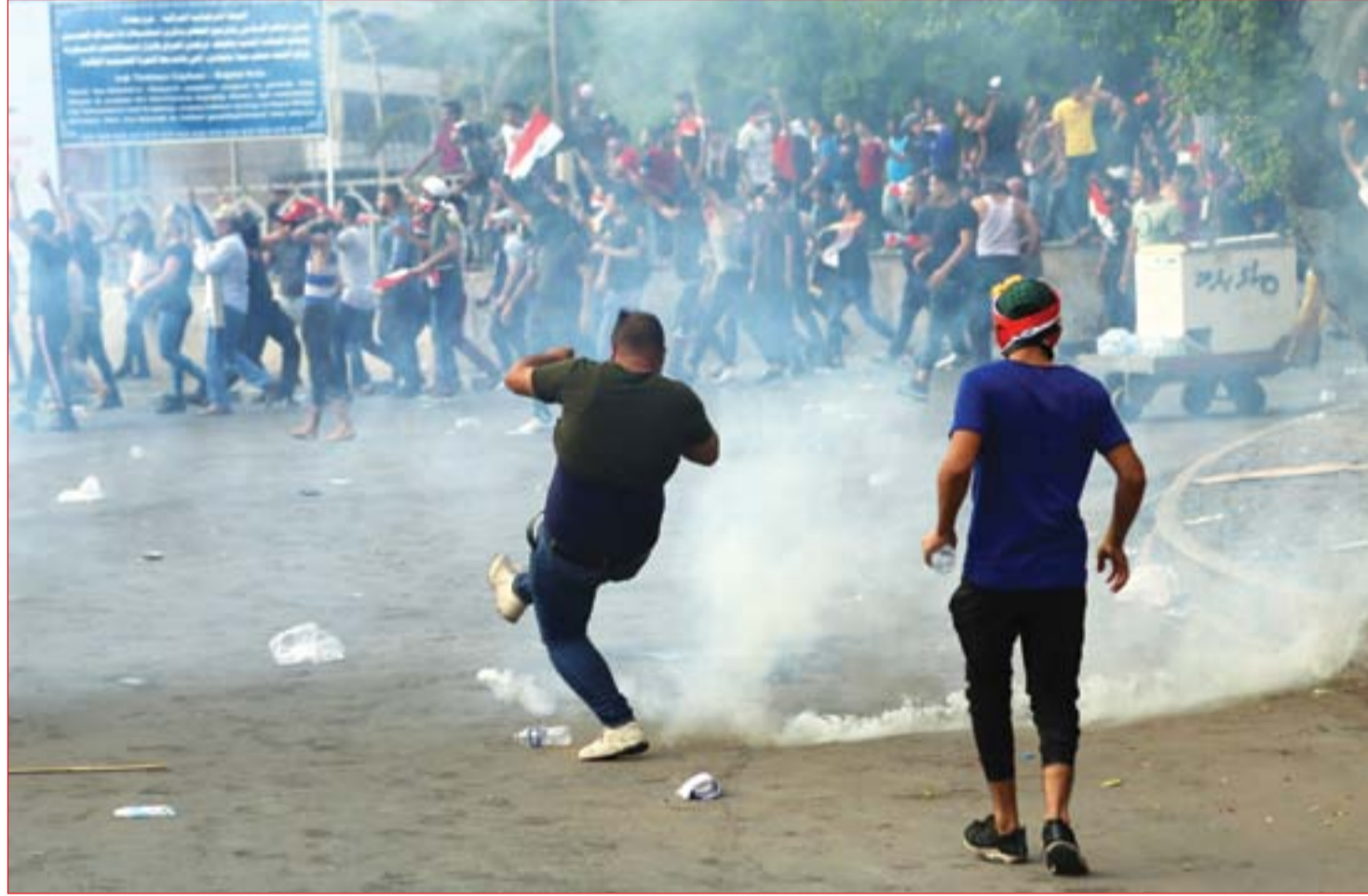
وعود حكومية وبرلمانية تخفف من التظاهرات.....

قاطع أكثر من 200 نائب جلسة البرلمان المقررة لمناقشة تداعيات حركة الاحتجاجات في بغداد ومحافظات أخرى. ونتيجة للمقاطعة، اكتفت رئاسة البرلمان بعقد اجتماع مع شخصيات ادعت أنها تمثل الحركات الاحتجاجية للاستماع لمطالبهم.