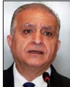
محمد علي الحكيم