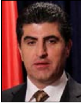
نجيب فرحان بارزاني