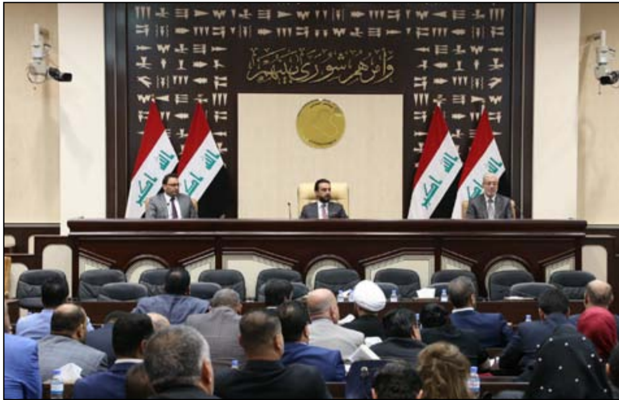
جلسة سابقة لمجلس النواب

نتائج التحقيقات بشأن قتل المتظاهرين منوهة إلى أن "مطالب المتظاهرين هي الأهم في الفترة الحالية".