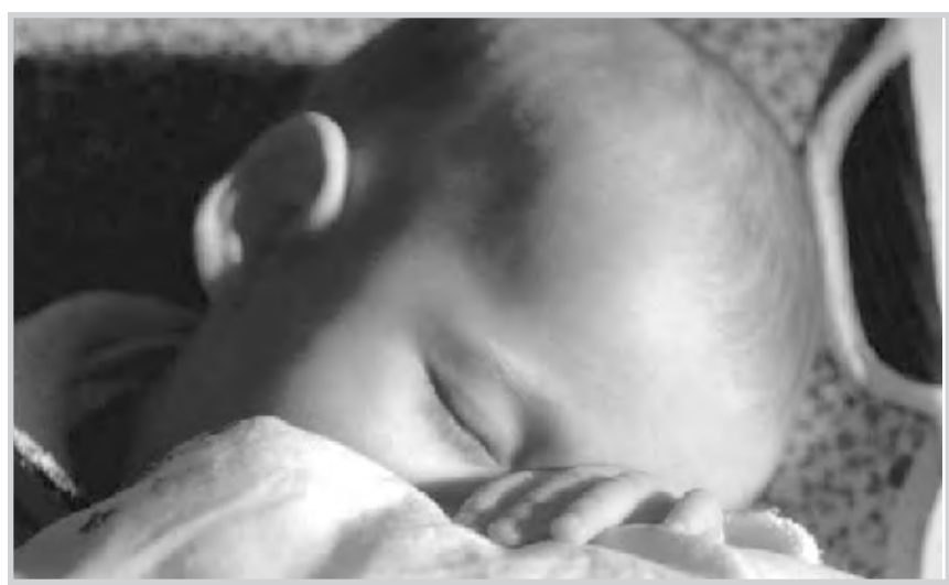
ما كك ما يتصنح المرء يدركه تجري الرياح بما لا تشتهي السفن