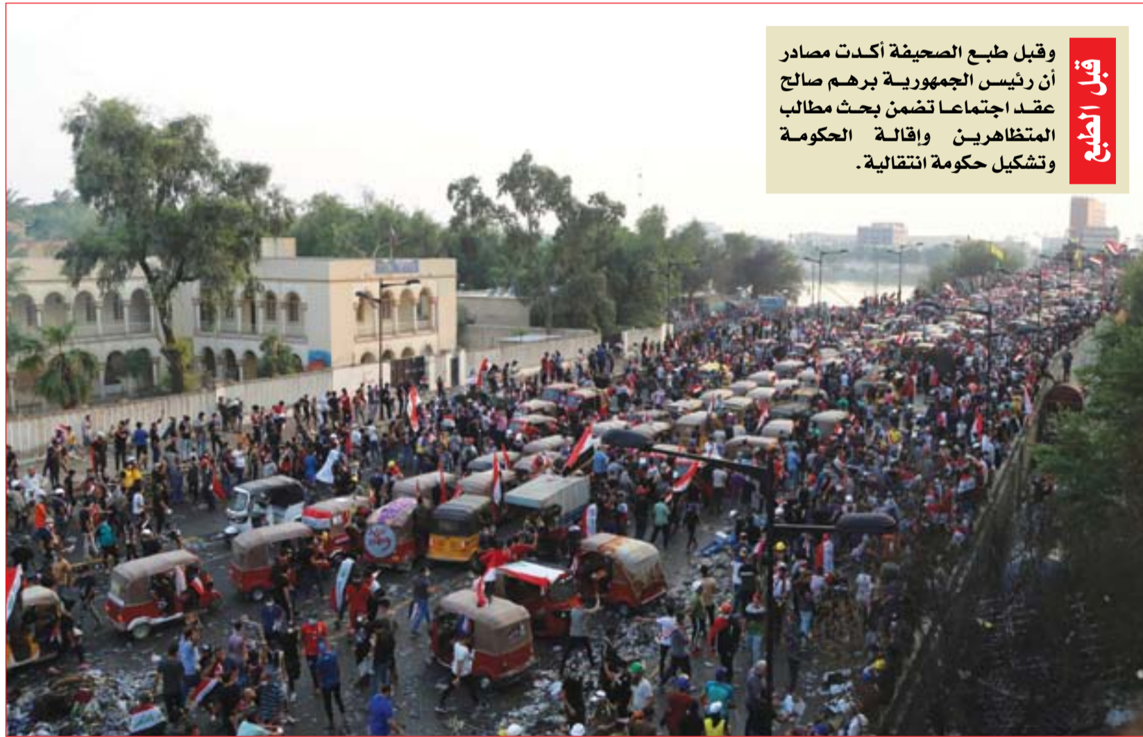
المظاهرون على جسر الجمهورية بعد انسحاب جزئي للجيش..... عدسة: محمود رؤوف

الجامعة العربية تعبر عن انزعاجها لتصاعد العنف ضد المظاهرين