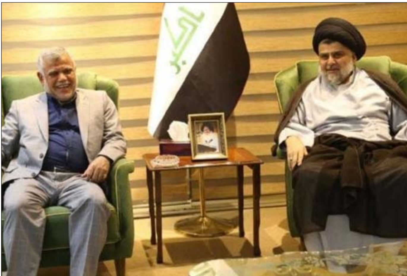
لقاء سابق بين الصدر والعامري.. أرشيف

التقرير الأممي تحذير قوي لنا، يأتي في الوقت المناسب تماماً، فالقوى السياسية المتفردة منخرطة الآن كلياً في صراعاتها ومنافساتها على السلطة والنفوذ والمال عشية بدء أعمال مجلس النواب الجديد وتوزيع المناصب الحكومية المسبلة للعبث كالعادة، وليس من المرجح أن تتخلى هذه القوى عن صراعاتها ومنافساتها والالتفات إلى الخطر الذي لم يزل داعش يمثلته ويحذر منه التقرير الأممي الأخير.