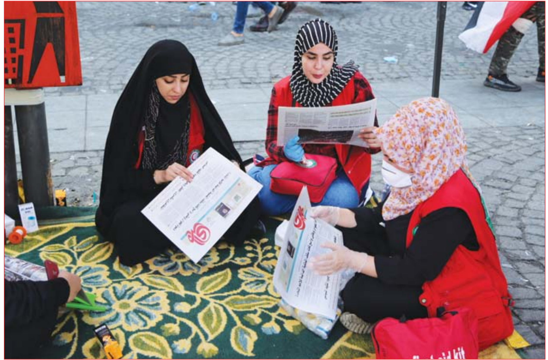
جريدة المدى في ساحة الاحتجاج.....

فيما يرى تحالف الفتح الذي يتزعمه هادي العامري ان مطلب الصدر "غير مضمون" ويقول إن الخيار الأسلم استبدال الحكومة مع المحافظة على البرلمان. بالتزامن مع ذلك مازال الشارع يضغط