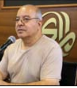
روح جواد تسكن نصب الحرية