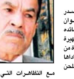
مع التظاهرات التي تشهدها مدن العراق رفضا للمحاصصة والطائفية.

ناظم السماوي الشاعر الشعبي الكبير يصدر له قريبا ديوان شعري بعنوان "ياحريمة" يضم عددا من قصائده الاخيرة اضافة الى قصيدته الشهيرة يا حريمة التي اشتهرت كواحدة من ابرز اغنيات الثمانينيات والتي اداها الفنان حسين نعمة ولحنها للحن الراحل محمد جواد اموري.