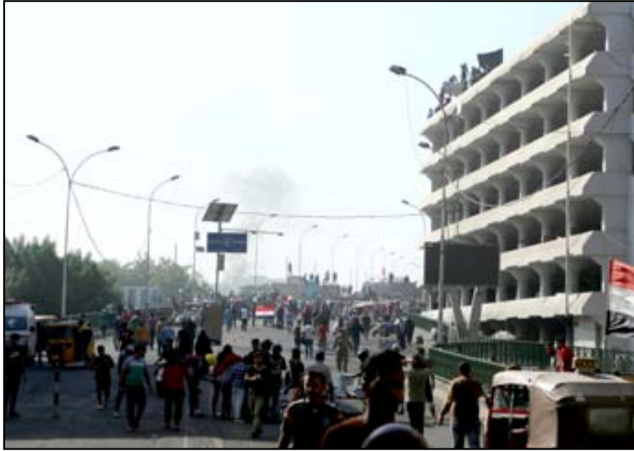
متظاهرون على جسر السنك.

تراشقوا مع القوات الامنية بالحجارة والتي ردت عليهم بالقنابل المسيلة للدموع. واكد معتصمون في بيان ثالث