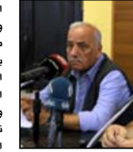
روح جواد تسكن نصب الحرية