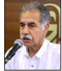
روح جواد تسكن نصب الحرية