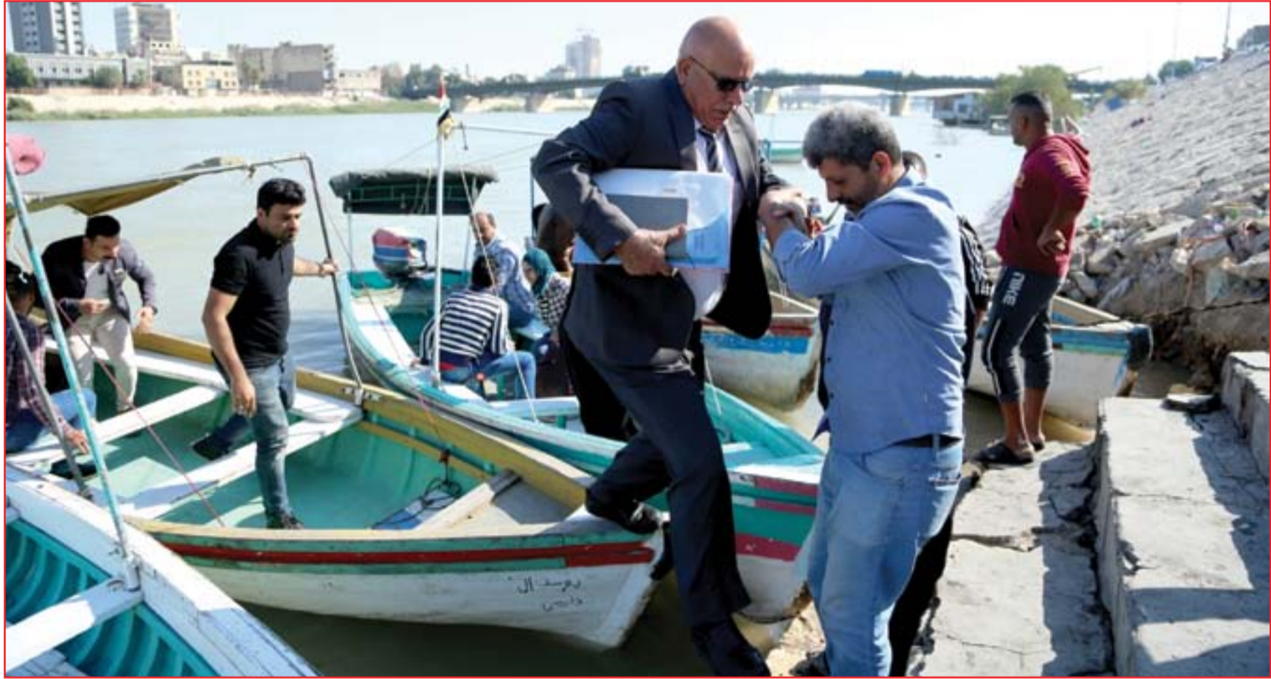
انقطاع جسور قلب العاصمة مستمر ولا بدليل للبعثيين سوى القوارب..

2 القوات الأمنية تعزز إجراءاتها على الحدود تزامناً مع تحرك داعش في سوريا