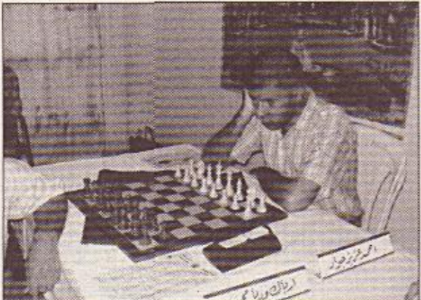
أحد لاعبي الشطرنج في بطولة سابقة