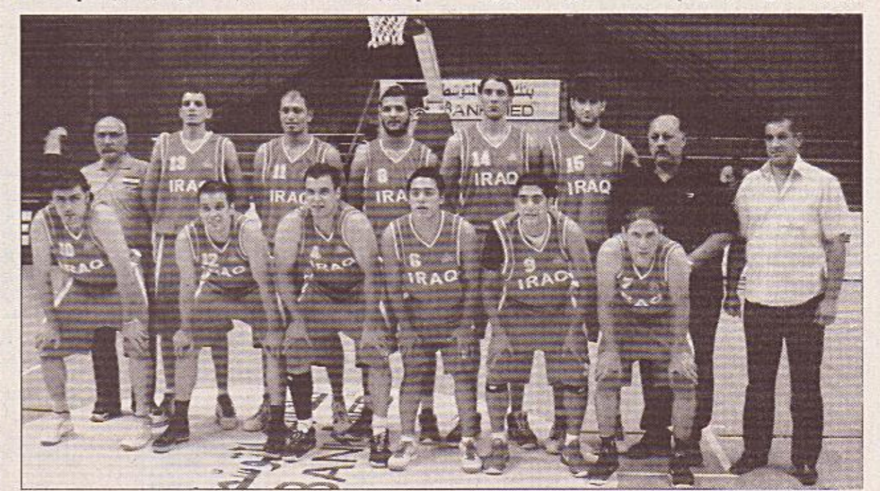
السلة العراقية امام تحد جديد

وقد استعدى مدرب المنتخب فكرة توما ١٣ لاعبا للتحاق بهذا المعسكر التدريبي الذي يستمر لغاية العشرين من حزيران توما اول من امس انطلاق البطولة بيوم واحد نظرا لقصر الفترة المتبقية على انطلاق البطولة التي يسعى فيها منتخبا مدينة دهوك في الحادي والعشرين من حزيران الحالي بمشاركة خمسة منتخبات هي الاردن وسوريا ولبنان وإيران إضافة إلى منتخبنا الوطني.