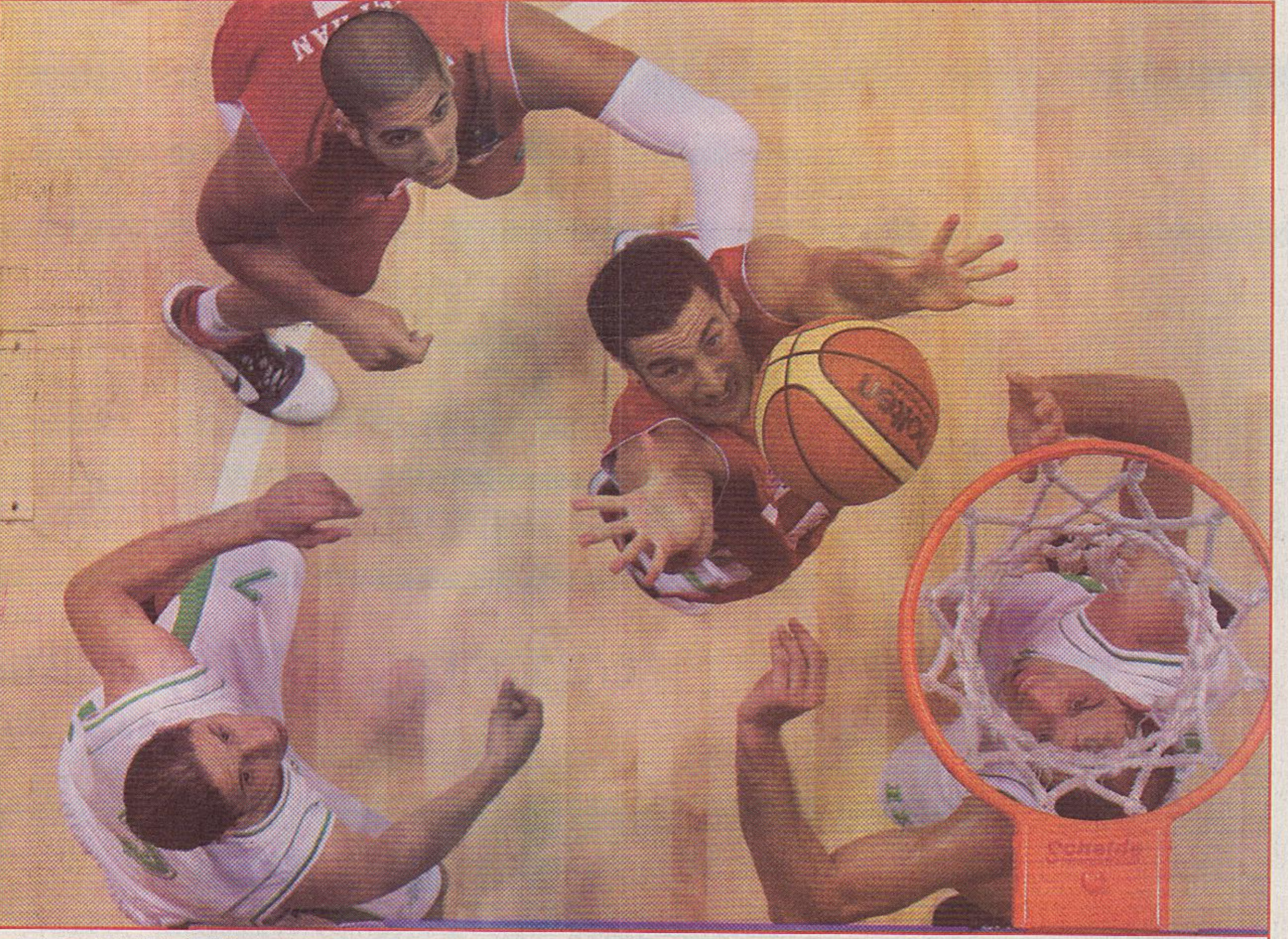
دهوك تنمي تحضيراتها لتضييف بطولة غرب آسيا لكرة السلة