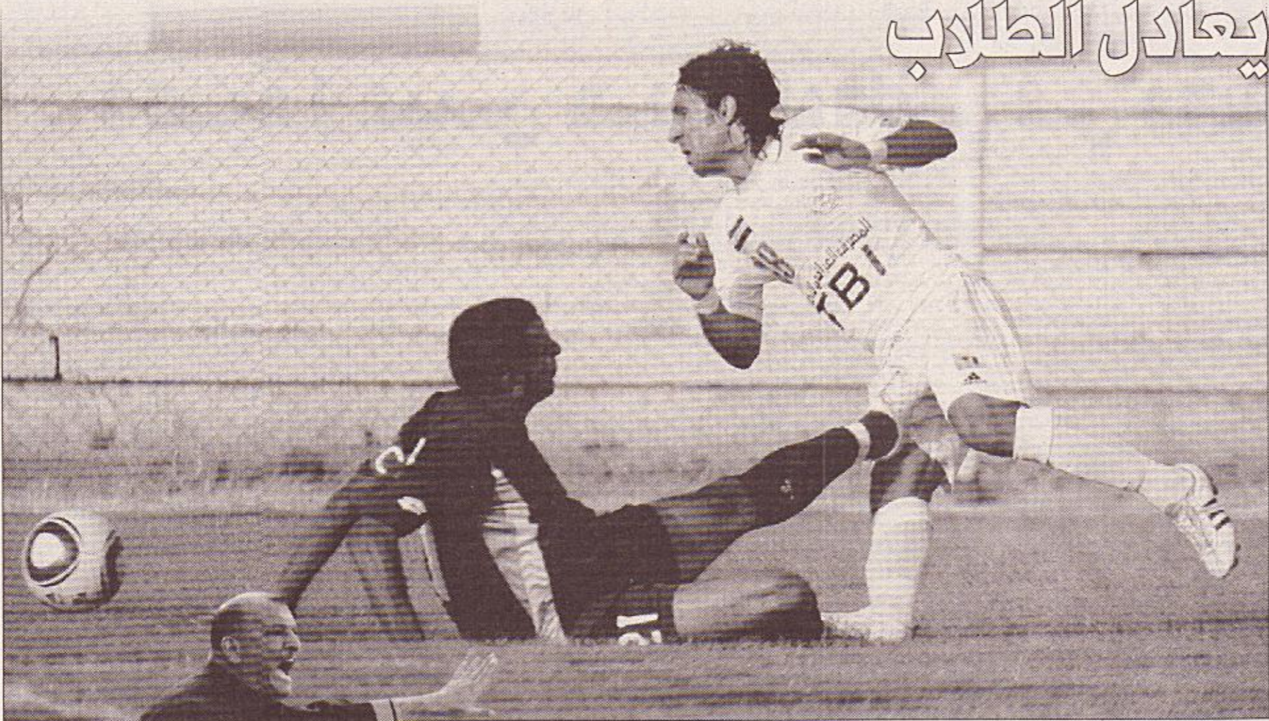
الزوراء حافظ على الصدارة بعد جولة الميناء المثيرة