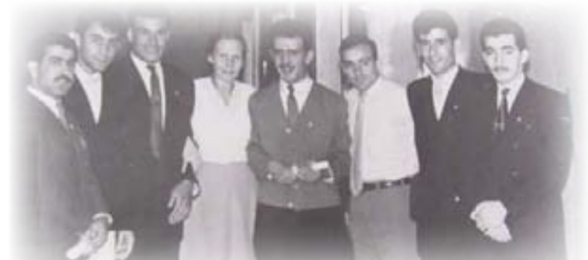
لفيف من الطلبة العراقيين مع زوجة فيد في موسكو