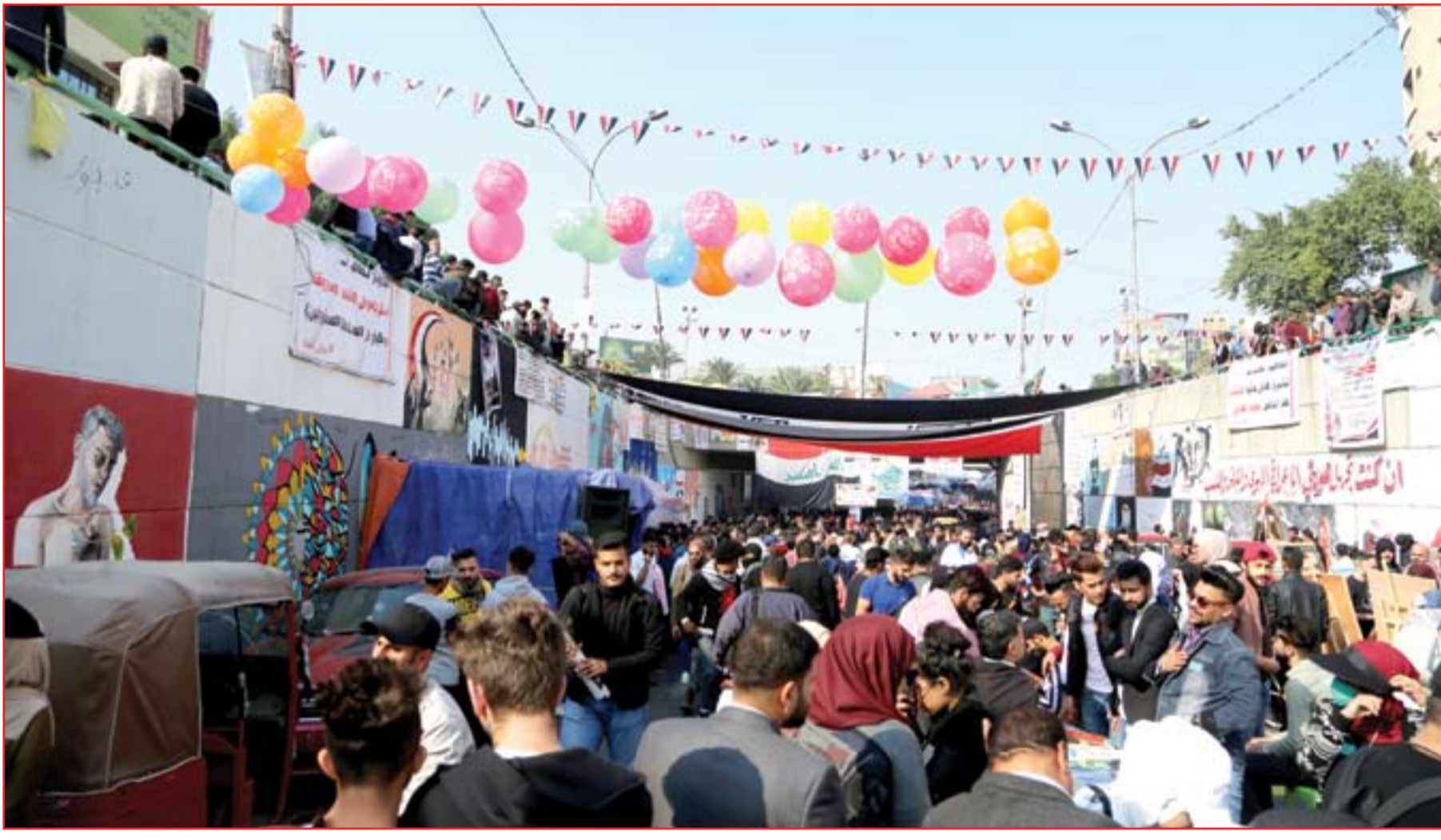
بازار في نفق التحرير أمس..

خوفا من المحاسبة العشائرية. وفي وقت سابق كانت فصائل "الحشد الشعبي" نفت صحة اتهامات بصلو عنها في قمع متظاهرين خلال الاحتجاجات. واعتبرت مديرية أمن الحشد في بيان