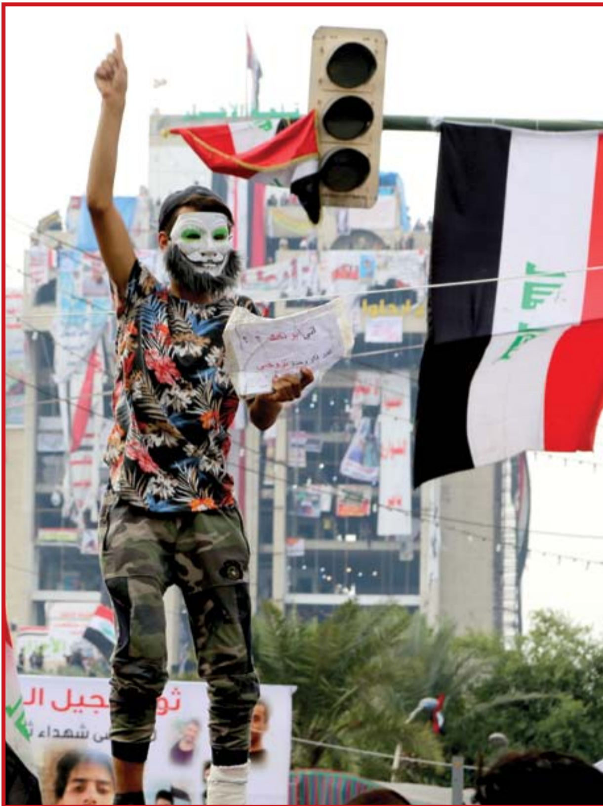
من أمام قلعة المطعم التركي وسط ساحة الاحتجاج..

المراد الذين يتنازعون مع بغداد عائدات النفط. لكنه أصبح الأحد أول رئيس حكومة يترك منصبه قبل نهاية ولايته، في عراق ما بعد العام ٢٠٠٣. استقال تحت ضغط المتظاهرين الذين يربطونه بفضيحة عمرها عشر سنوات، متهمين أعضاء من فريق أمنه الشخصي بارتكاب جريمة دامية في أحد مصارف بغداد. ولكن أيضاً بضغط من المرجعية الشيعية الأعلى في البلاد وحلفائه من الحشد الشعبي الذين دعوا أخيراً إلى "التغيير". وكان رئيس الوزراء المستقل، كما يقول