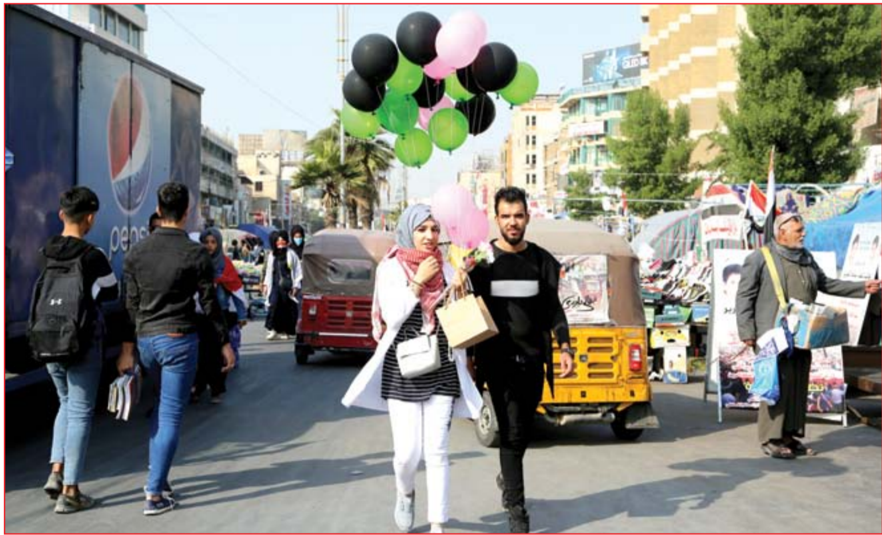
فرحة المحتجين بقبول مجلس النواب إستقالة رئيس الوزراء..

تواصل رئاسة البرلمان واللجنة القانونية لقاءاتها مع ممثلي الأمم المتحدة لانضاج قانون انتخابي لمجلس