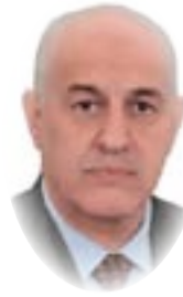
القاضي سالم روضان الموسوي

لأن البعض يرى بان الدستور قد جعل عدد أعضاء مجلس النواب بمقدار نسبة معينة وهي نائب لكل مائة ألف نسمة وعلى وفق ما جاء في المادة (49/أولا) من الدستور التي جاء فيها الآتي (يتكون مجلس النواب من عدد من الأعضاء بنسبة مقعد واحد لكل مائة ألف نسمة من نفوس العراق يمثلون الشعب العراقي بأكمله، يتم انتخابهم بطريق الاقتراع العام السري المباشر، ويراعى تمثيل سائر مكونات الشعب فيه) وللوقوف على هذه النقطة الدستورية أعرض الآتي :