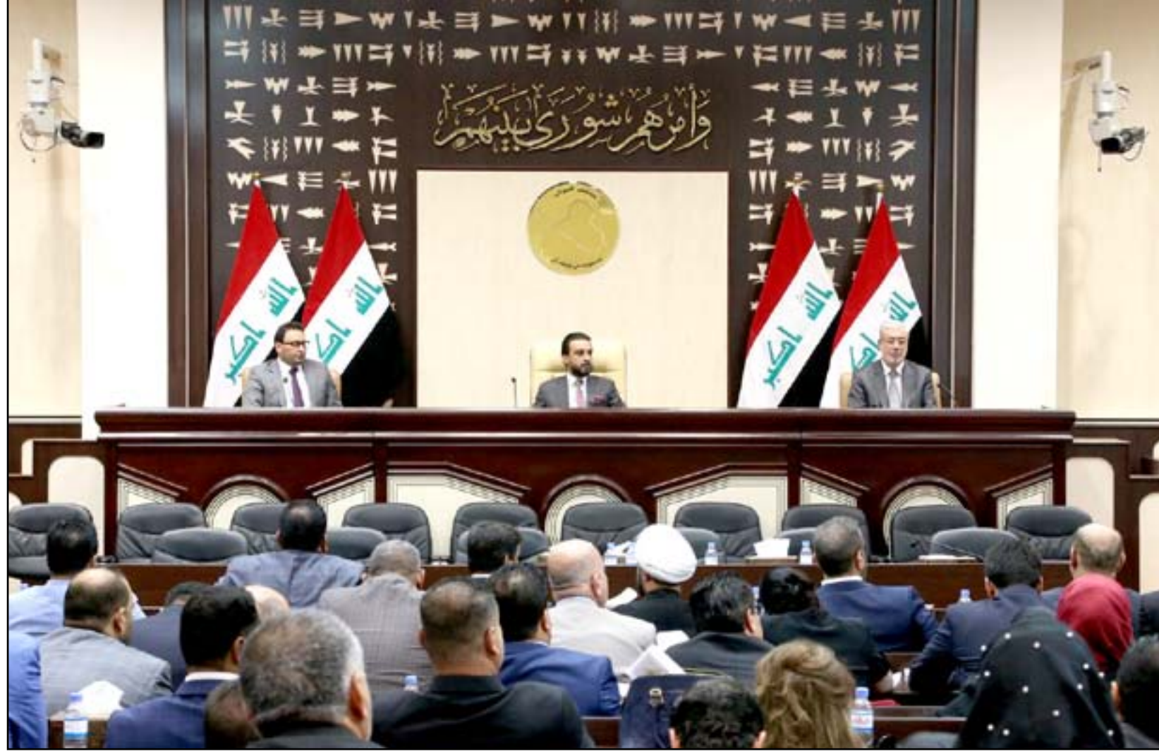
جلسة سابقة لمجلس النواب

وتابع: "لن نصوت على العد والفرز الإلكتروني، وفي حال تم تمرير هذه الفقرة في قانون الانتخابات سنعتبره باطلاً، بل سيكون مرفوضاً من قبل الجماهير، وعلى الشارع العراقي المنتفض ان يطلب بقوة إلغاء هذه الطريقة احتراماً لإرادته ولضمان ابصال صوته في الانتخابات المقبلة، وأن يشترط للقانون الجديد عدم السماح بالإبقاء على العد والفرز الإلكتروني".