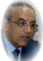
هادي عزيز علي

الطريق أمام رئيس مجلس الوزراء، لم يبق والحالة هذه سوى الطريق الآخر الذي نصت عليه المادة (64) المشار إليها أعلاه، المتمثل بتقديم طلب من ثلث أعضاء مجلس النواب الى رئاسة المجلس، إذ يحل مجلس النواب والحالة هذه عند حصول الأغلبية المطلقة لعدد أعضاء مجلس النواب وليس الأغلبية النسبية، وبعبارة أخرى نصف أعضاء المجلس زائد واحد حتى يتم حل المجلس. وهنا يبرز السؤال التالي: هل يمكن المجلس من الحصول على توافيق ثلث أعضاء مجلس النواب لحل نفسه؟ هل يكون ذلك سبباً عليهم؟ هل يختمون نهايتهم بهذا الوضع المجمع بالنسبة لهم؟ كيف يكون لهم ذلك وهم يعتبرون المقعد غنيمية؟ وإن التوقيع على طلب الحل يعد نهاية للامتيازات والمكاسب والوضع الباذخ ونهاية لنظام المحاصصة بعد أن بذلوا الغالي والنفيس في سبيل ترسيخه واعتماده منجلاً للسلوك السياسي وهو من أوصلهم الى ذلك الوضع. ماذا لو أن أعضاء مجلس النواب قد حججوا بكافة الحجج وقالوا: لا يمكن من الوصول الى العدد المطلوب دستوريا واعتمدوا المطالبة؟ أو أن رئيس مجلس النواب قال إن الأعضاء يرفضون التوقيع على نهايتهم النيابية؟ وهذا يعني عدم تقديم طلب الحل، وبذلك السبل للحلول دون تقديم طلب الحل.