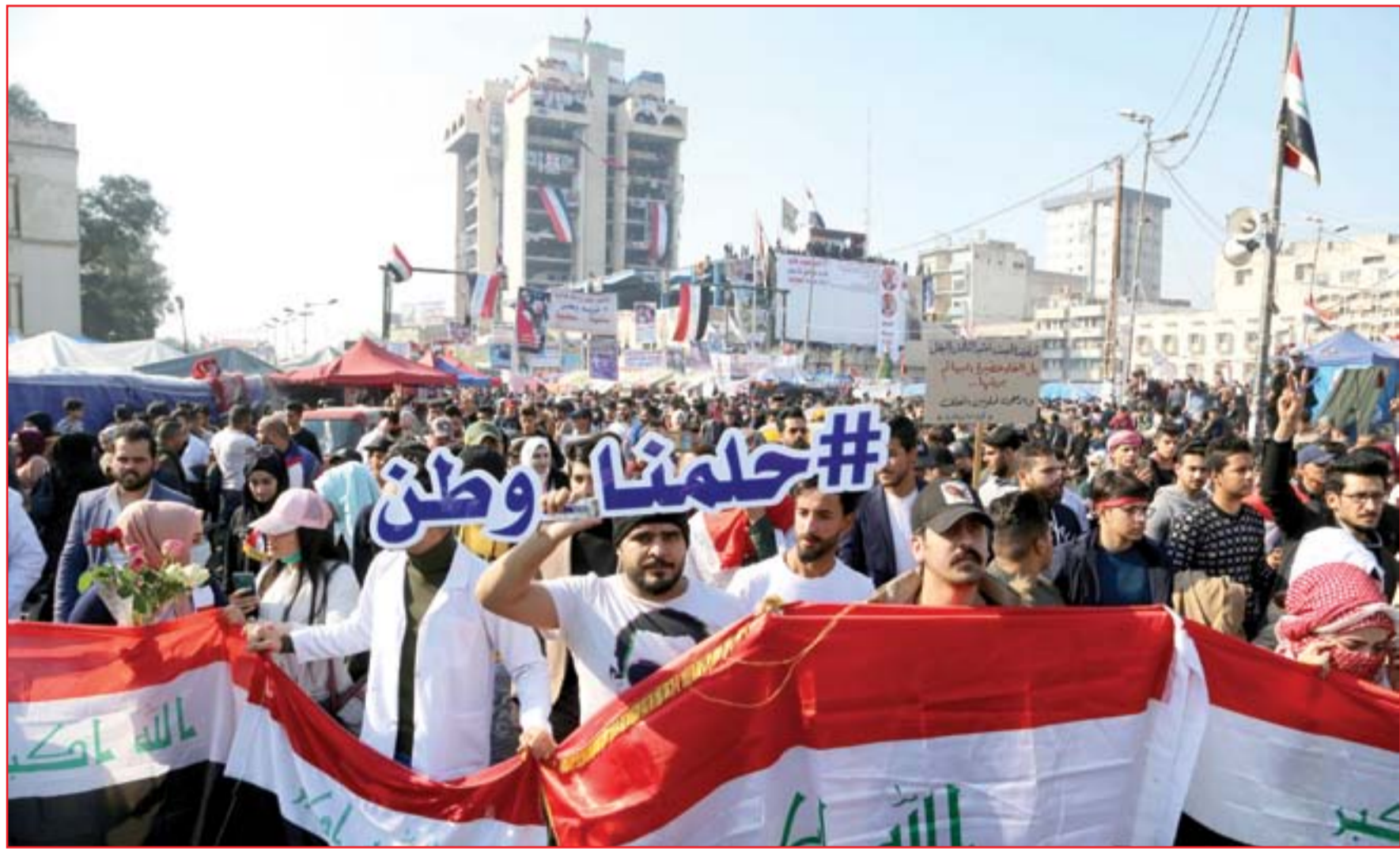
الطلة يملأون ساحات الاحتجاج رفضاً لمرشحي الكتل..

في عام 2019، عدد الصحفيين القتلى انخفض إلى النصف مقارنة بالعام الماضي