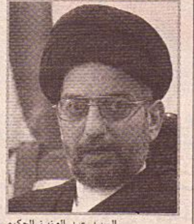
السيد عبد العزيز الحكيم

خطة فرض القانون وتنشيط المحاولات والجهود التي من شأنها المساعدة في عملية انجاح الصالحة الوطنية وتحقيق المشاركة الفعلية في الحكم وتنفيذ الاتفاقات الواعدة بين الاطراف المشاركة في الحكومة وارساء مبدأ التوافق والمساهمة الحقيقية لجميع الاطراف في ادارة البلاد ورسم القرارات الهامة. كما تم التأكيد على ضرورة استمرار الولايات المتحدة الامريكية في التزاماتها الامنية والسياسية تجاه العراق. وشدد الرئيس طالباني والوفد الزائر على توثيق العلاقات الثنائية بين البلدين الصديقين، العلاقات الكردستانية والحزب الاسلامي، وسناقشة السبل الكفيلة بانجاح الصالحة الوطنية وتوفير الامن والاستقرار في البلاد.