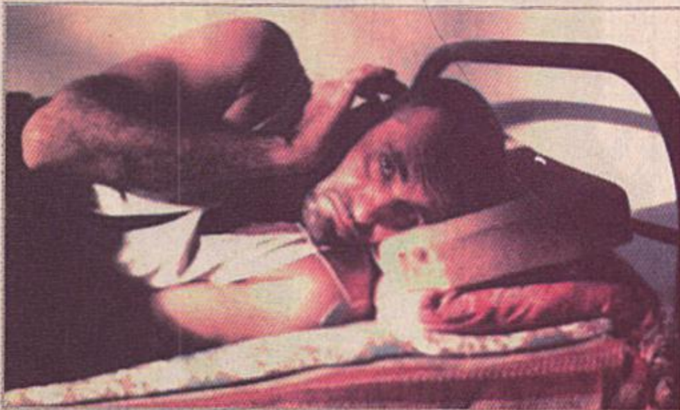
لقطة من فيلم (احلام)

تصوير الفيلم التسجيلي الروائي (شهب تهاوت) سيناريو واخراج الفنان شهاب احمد وتصوير الفنان ستار راشد وضاءة الفنان حيدر زهراوي والصوت للفنان سعد لطيف صالح والمنتج المتنت قاسم محمد سلمان والاشراف