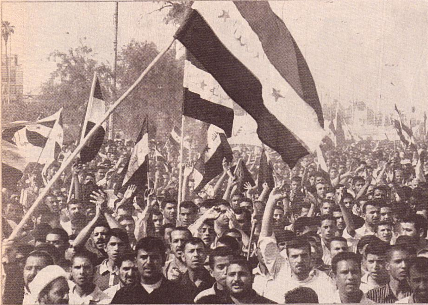
تظاهرة سلمية في بغداد

العمل من أجل سعادة شعبنا بكل شرائحه الاجتماعية. ثم الفت رئيسة لجنة المرأة والأسرة والطفولة في مجلس النواب سميرة جعفر الموسوي كلمة قالت فيها: نشكر لكم هذا الجهد الكبير والمفرح لفصليات المجتمع المدني، لأن منظماته ركن أساسي في بناء دولة القانون والدستور. وأضافت الموسوي: إن الديمقراطية مفهوم تطور عبر التاريخ وعبر تطور المجتمعات والثقافات، ويتمثل في تحقيق المساواة بين الناس في فرص الحياة في جميع المجالات السياسية والاقتصادية والاجتماعية بغض النظر عن الفوارق الطبيعية والمكتسبة، إذ هي المشاركة في القرارات التي تؤثر في حياة الفرد ومصيره، من هنا فهو يعتمد على المواطنة أساساً لبنائه.