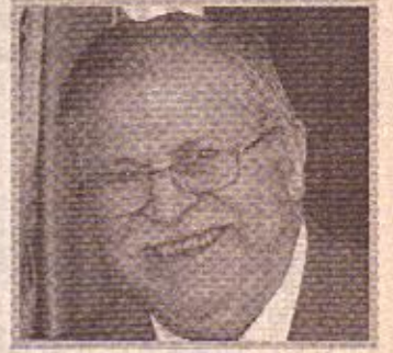
بغداد / الصفا استقبل رئيس الجمهورية جلال طالباني

ظهر امس في محل اقامته ببغداد جون هانا مساعد نائب الرئيس الامريكى ذلك شنيك لثؤون الشرق الاوسط برفقة السفير راين كروكر السفير الامريكى في العراق. وفي اللقاء الذي حضره لطيف رشيد وزير الموارد المالية وسعدى احمد بيره وكامران قراداعي رئيس ديوان رئاسة الجمهورية وكالة نقل الوفد الزائر لحيات نائب الرئيس الامريكى الى الرئيس طالباني متمنياً له الموفقية والنجاح في مهامه المصيرية في العراق. وتحدث الرئيس طالباني في هذا اللقاء عن مجمل التطورات السياسية والجهود المبذولة من اجل حلال الامن والاستقرار، مشيراً الى جهود المتواصلة لتضييق دائرة العنف والارهاب وتوسيع مساحة المشاركة السياسية، ونقاش الجانبان آليات مساندة