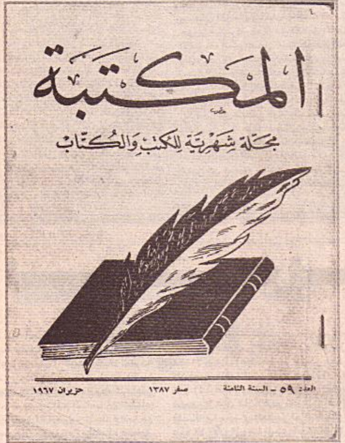
المكتبة بجدة شهيرة للكتب والمكتبات العدد ٥٩ - السنة الثامنة - صفر ١٣٢٧ حزيران ١٩٦٧