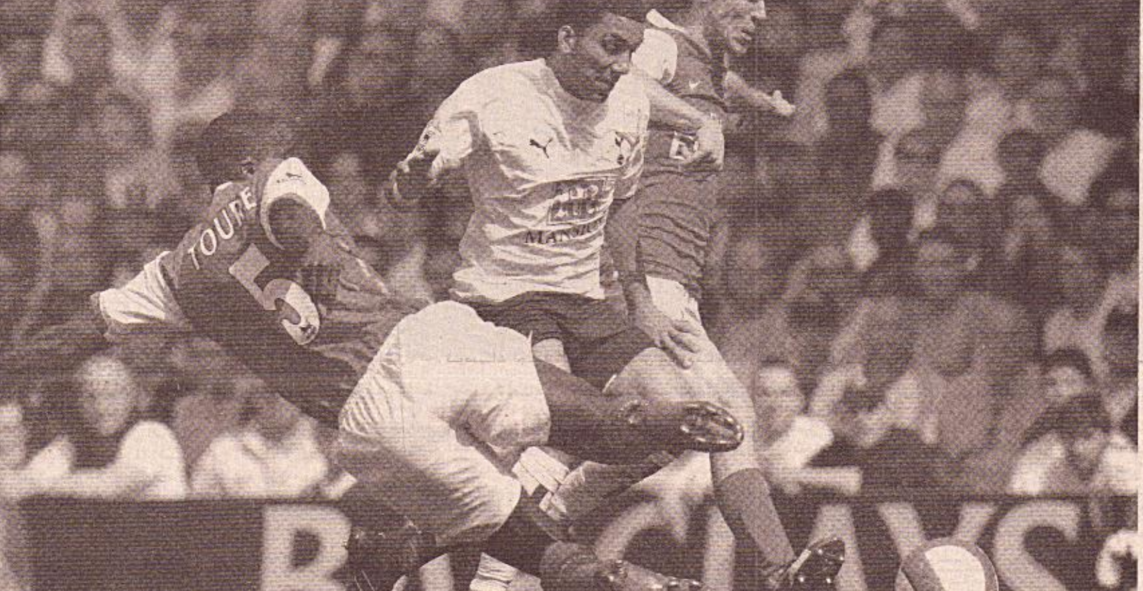
جيناس يحرم ارسال من ملحقه ماتشستر و تشيلسي