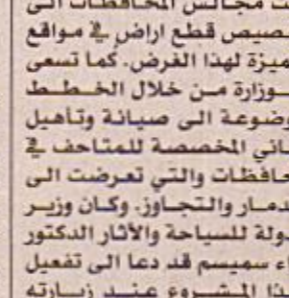
بغداد / الصدا طالبت مفتشية اشار وترتات نيوي الدوائر الحكومية في المحافظة لبيان موقفها من قطعة الارض المخصصة لبناء متحف حضاري عليها في قضاء

دعت مجالس المحافظات الى تخصيص قطع اراض في مواقع متميزة لهذا الغرض. كما تسمى الوزارة من خلال الخطط الموضوعية الى صيانة وتأهيل المباني المخصصة للمتاحف في المحافظات والتي تعرضت الى الدمار والتجاوز. وكان وزير الدولة للسياحة والآثار الدكتور نواز سميسم قد دعا الى تفعيل هذا المشروع عند زيارته مفتشيات الآثار في محافظات النجف وبابل والديوانية وكربلاء والمثنى.