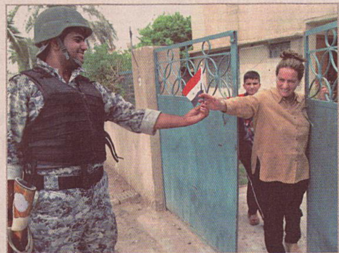
ترحيباً بالامن .. بغداد ٢٢/٤/٢٠٠٧

بغداد / وكالات قال وزير الدفاع عبد القادر محمد جاسم: ان للوزارة عقوداً عديدة لشراء طائرات نقل واستطلاع ومراقبة وطيركوبتر، فيما اشار جنرال امريكي إلى استبدال بنادق الكلاشنكوف التي جهز بها الجيش العراقي بينادق اوتوماتيكية نوع MI 6.