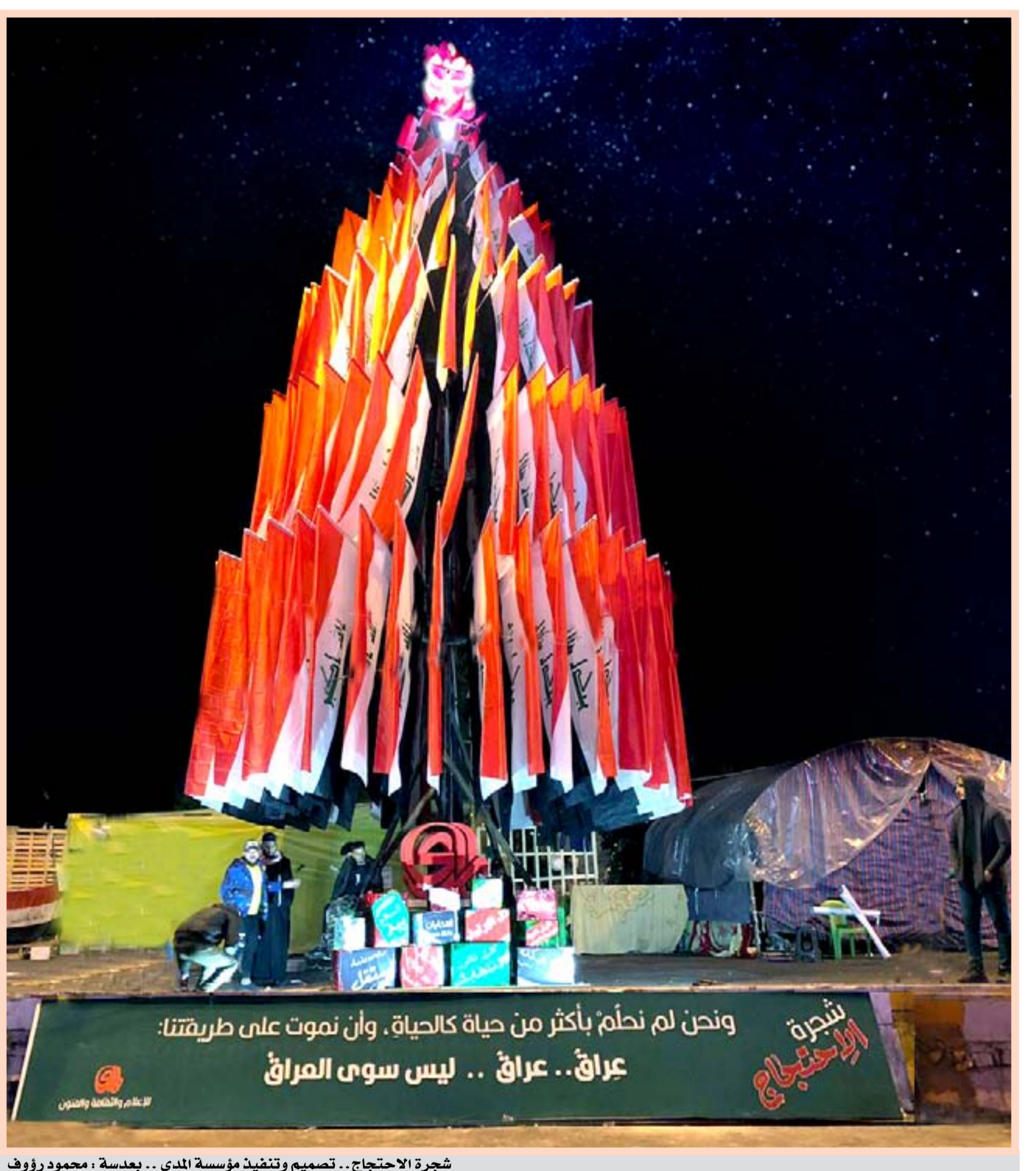
شجرة الاحتجاج.. تصميم وتنفيذ مؤسسة المدى.. بعدسة: محمود رؤوف