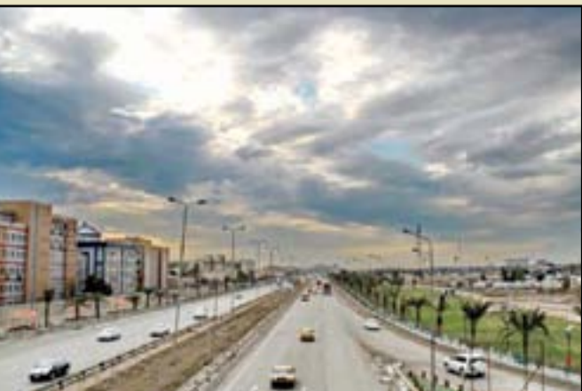
مظاهرهم يحتفلون بأعياد الميلاد في ساحات الاحتجاج..

سيكون الطقس في المنطقة الجنوبية غائماً جزئياً. وتابعت الهيئة أن "الطقس في المنطقة الوسطى ليوم السبت المقبل غائم جزئي مع وجود ضباب يزول تدريجياً وغائم جزئي في المنطقة الجنوبية مع انخفاض قليل في درجات الحرارة، أما المنطقة الشمالية فسيكون الطقس فيها ممطراً"، مضيفاً أن "الطقس ليوم الأحد المقبل ممطر في المنطقة الشمالية وغائم جزئي في المنطقتين الوسطى والجنوبية مع وجود ضباب يزول تدريجياً وانخفاض قليل في درجات الحرارة".