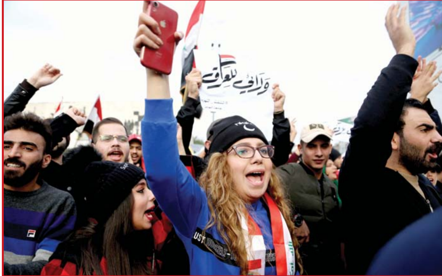
متظاهرون في ساحة التحرير..

بغداد / المدى على غرار اخبار اعلان الاقليم السنّي، عاد بعض المحتجين في الجنوب للحديث عن "فدرالية البصرة" بعد تجاهل السلطة للمطالب الشعبية وتساعد حالات الاغتيال. ومرة أخرى من ١٠٠ يوم على حوادث القتل التي تعرض لها متظاهرون