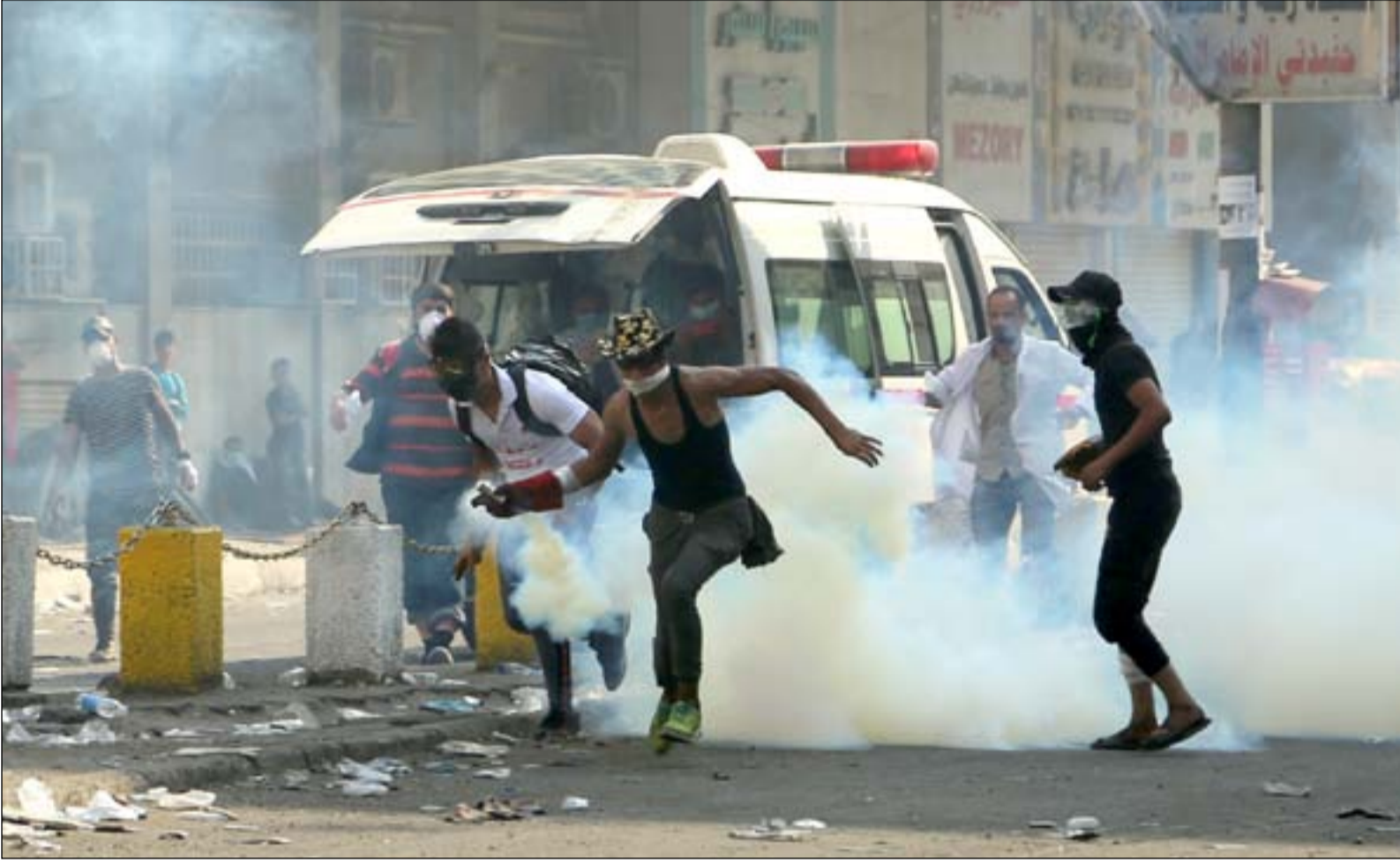
جانب من تظاهرات تشرين.. ارشيف