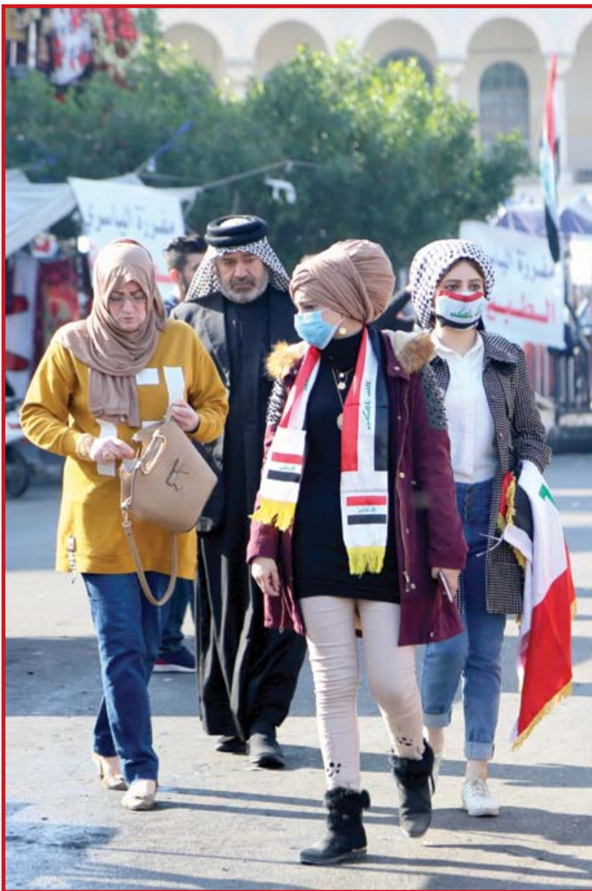
استمرار حركة الاحتجاج في ساحات التظاهر..

ترجمة: حامد احمد استناداً لمسؤول عسكري أميركي ومسؤولين أمنيين عراقيين فإن تنظيم داعش نفذ هجوماً على مواقع عراقية على الحدود مع سوريا، مشيرين إلى استغلال التنظيم للوضع الحالي الذي يعيشه البلد فضلاً عن قرار التحالف الدولي بقيادة الولايات المتحدة تعليق مهامه ضد تنظيم داعش ليجول جهوده واهتمامه لحماية قواعد عراقية وقوات التحالف وسط توترات مع إيران. وقال مسؤولون عراقيون إن مسلحي التنظيم نفذوا ليل الاثنين هجمات على موقع عراقي أمني قرب الحدود مع سوريا متسببين بمقتل ضابط وجرح أربعة آخرين، وتم قتل أحد المسلحين المهاجمين خلال اشتباكات مع القوات الأمنية. وأضاف المسؤولون أن مسلحي