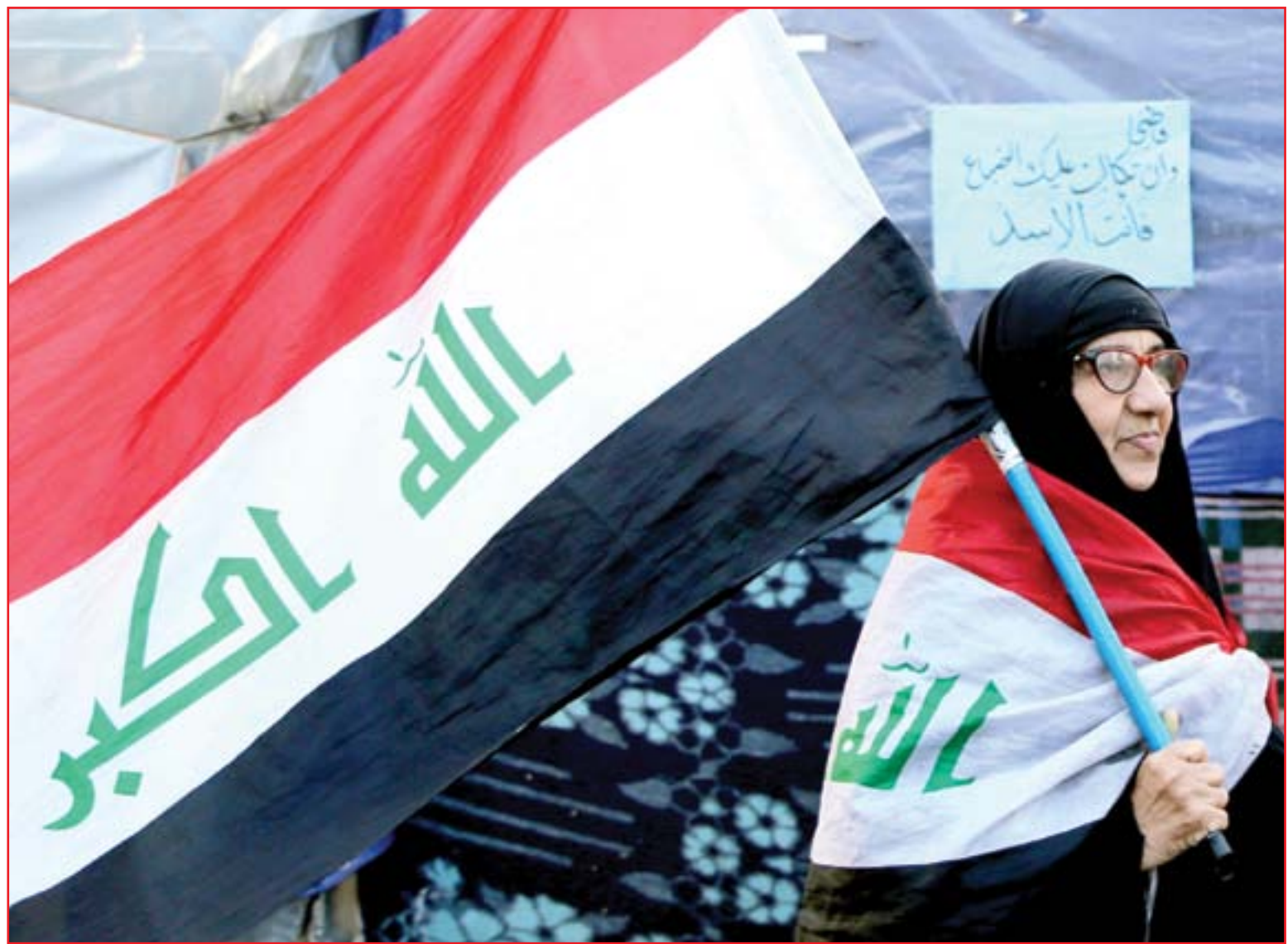
ساحات الاحتجاج تستعد لتصعيد سلمى غير مسبوقة...

7 «» لطيفة الدبمي تكتب عن الثقافة والسياسة، إمتاع أم إخضاع؟