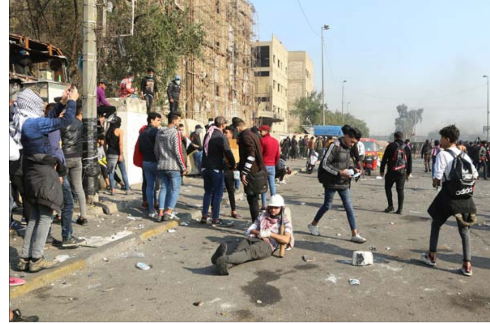
محتجون قرب سريع محمد القاسم بغداد