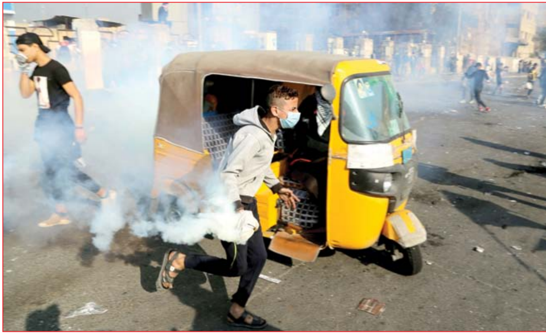
القوات الأمنية تواصل استخدام القنابل المسيلة لليوم الثاني على التوالي..