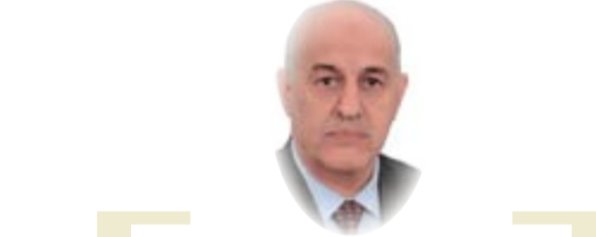
القاضي سالم روضان الموسوي

عمل أو قرار إداري من الطعن) فإن محكمة التمييز الاتحادية ما زالت على نهجها بالعمل بمفهوم "أعمال السيادة" حيث اعتبرت الاختصاص القضائي هو من أعمال السيادة وهو بمثابة توسيع للمفهوم لأنها أضافت نوعاً جديداً إلى طائفة الأعمال التي تدخل في مفهوم أعمال السيادة وعلى وفق ما جاء في قرارها العدد 219/هيئة موسعة/2011 في 21/8/2011 الذي جاء في حياثاته الآتي (وباعتبار إن الاختصاص القضائي يعتبر من أعمال السيادة) وارى بان العبارة في ظاهرها قد توحي إلى إن هذا نوع من أعمال السيادة إنما في مفهومها المتصل بسياق الحكم الذي صدر كانت تقصد به محكمة التمييز بان القضاء هو من أوجه السيادة للدولة وليس من أعمال السيادة ومع ذلك فان وجود هذه العبارة بقرار حكم صادر عن محكمة عليا في تدرج القضاء الاعتيادي يعد مصدر لاعتماده في مواضع أخرى، أما على مستوى القضاء الدستوري في العراق فان المحكمة الاتحادية العليا قد تصدت لهذا الأمر وقضت بعدم خاضعة للرقابة القضائية سواء في القضاء الدستوري أو القضاء الإداري باستثناء القضاء الاعتيادي في ما زال مكبل بالقيود والحظر المفروض عليه بموجب المادة (10) من قانون التنظيم القضائي رقم 160 لسنة 1979 المعدل ونأمل من المشرع أن يلتفت إلى هذه النقطة حتى يستقيم العمل على وفق المبادئ الدستورية الواردة في الدستور العراقي النافذ وفي المواد (19) و (87) و (88) ويذكر إن قانون المرافعات المدنية رقم 83 لسنة 1969 المعدل قد اعتبر ولاية القضاء ولاية عامة على وفق أحكام المادة (29) التي جاء فيها الآتي (تسري ولاية المحاكم المدنية على جميع الأشخاص الطبيعية والمعنوية بما في ذلك الحكومة وتخص بالفصل في كافة المنازعات إلا ما استثنى بنص خاص)