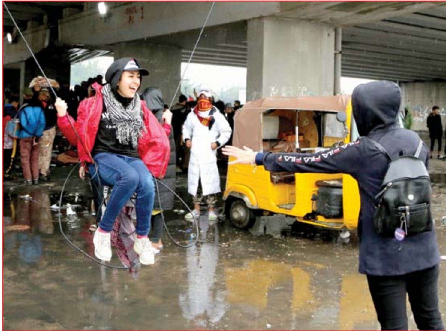
محتجون أسفل طريق محمد القاسم..

التيار الصدري مقتدى الصدر، من الاعتداء على "قوار تشرين"، وعلى الرغم من غزارة الامطار التي سقطت مساء اول امس، على بغداد والمدن الجنوبية، الا ان الاحداث الاخيرة تنذر بالتصعيد، خصوصاً مع تحذيرات انطلقت من البصرة بعد مقتل مسعفة وجرح اخرى في احدث هجوم