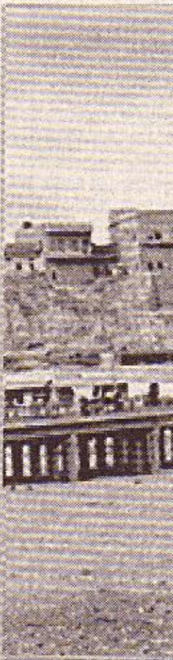
مدينة كركوك القديمة

ومن الملاحظ أن الارتضاع الحاد في مستويات العنف في المعدانية بعد آذار 2007 له أثر فيما يتعلق بالخيار الإداري لدى المجتمعات الضعيفة هناك. كما أن الوضع الأمني الصعب في العراق أثر بصورة مباشرة على التركيبة السكانية