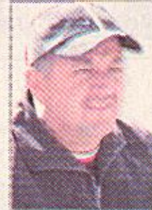
اهل الكرة متقلون بالفوز