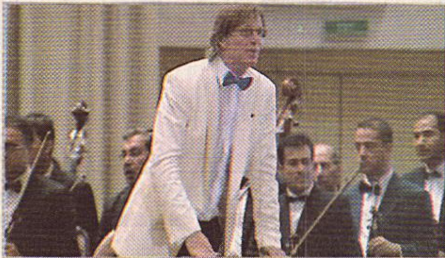
المزف البريطاني اولهر جيلمور يقود الفرقة السمفونية