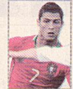
مواجهتان ساخنتان في افتتاح يوزع ٢٠٠٨