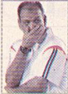
حمد برفض التصريح