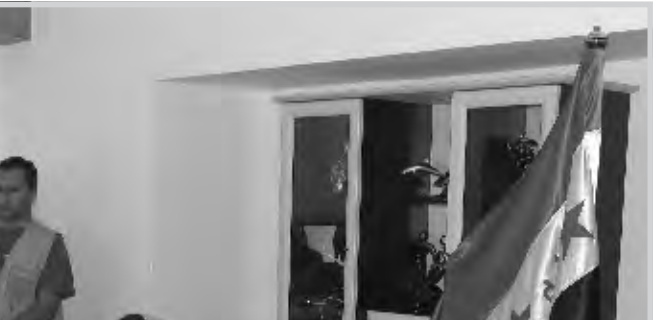
بغداد / الصدا