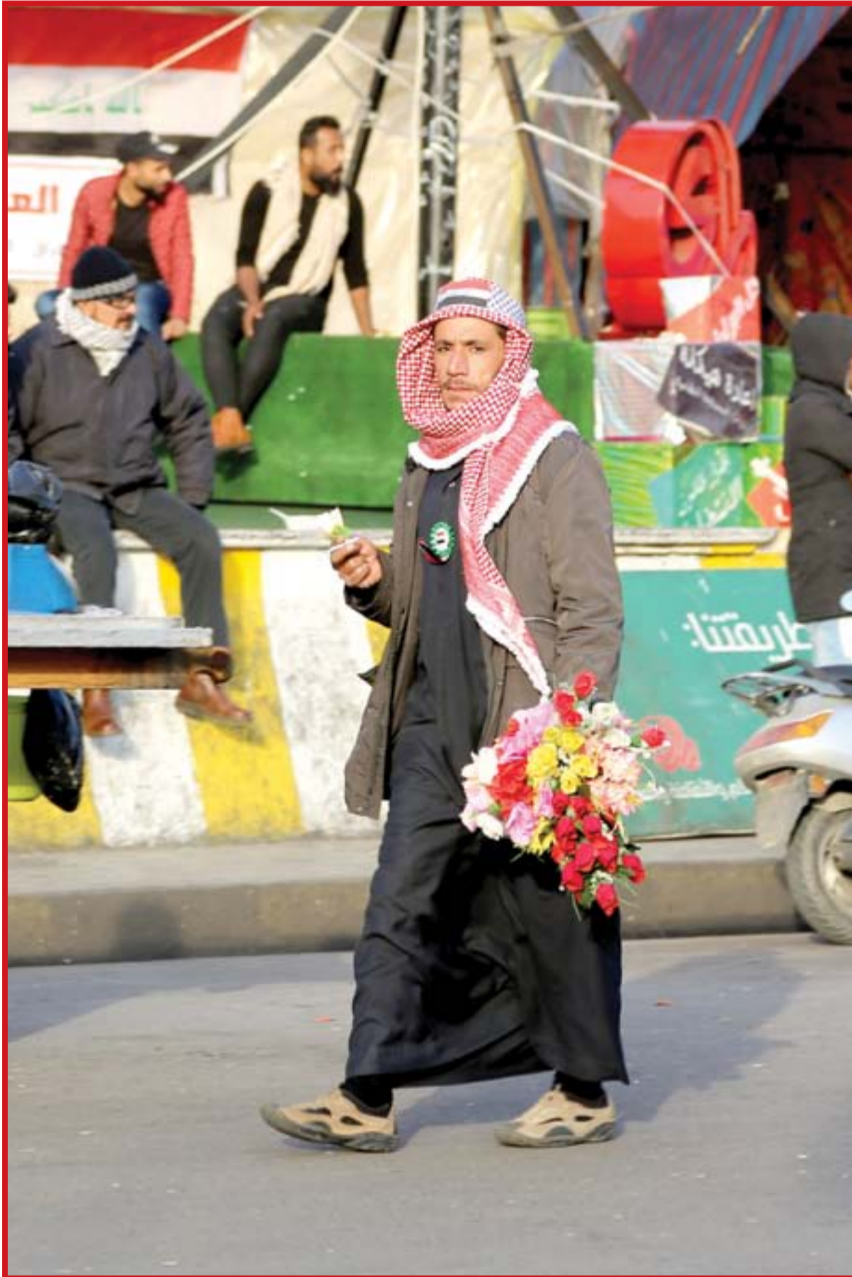
متظاهر يوزع وروداً على متظاهري ساحة التحرير..