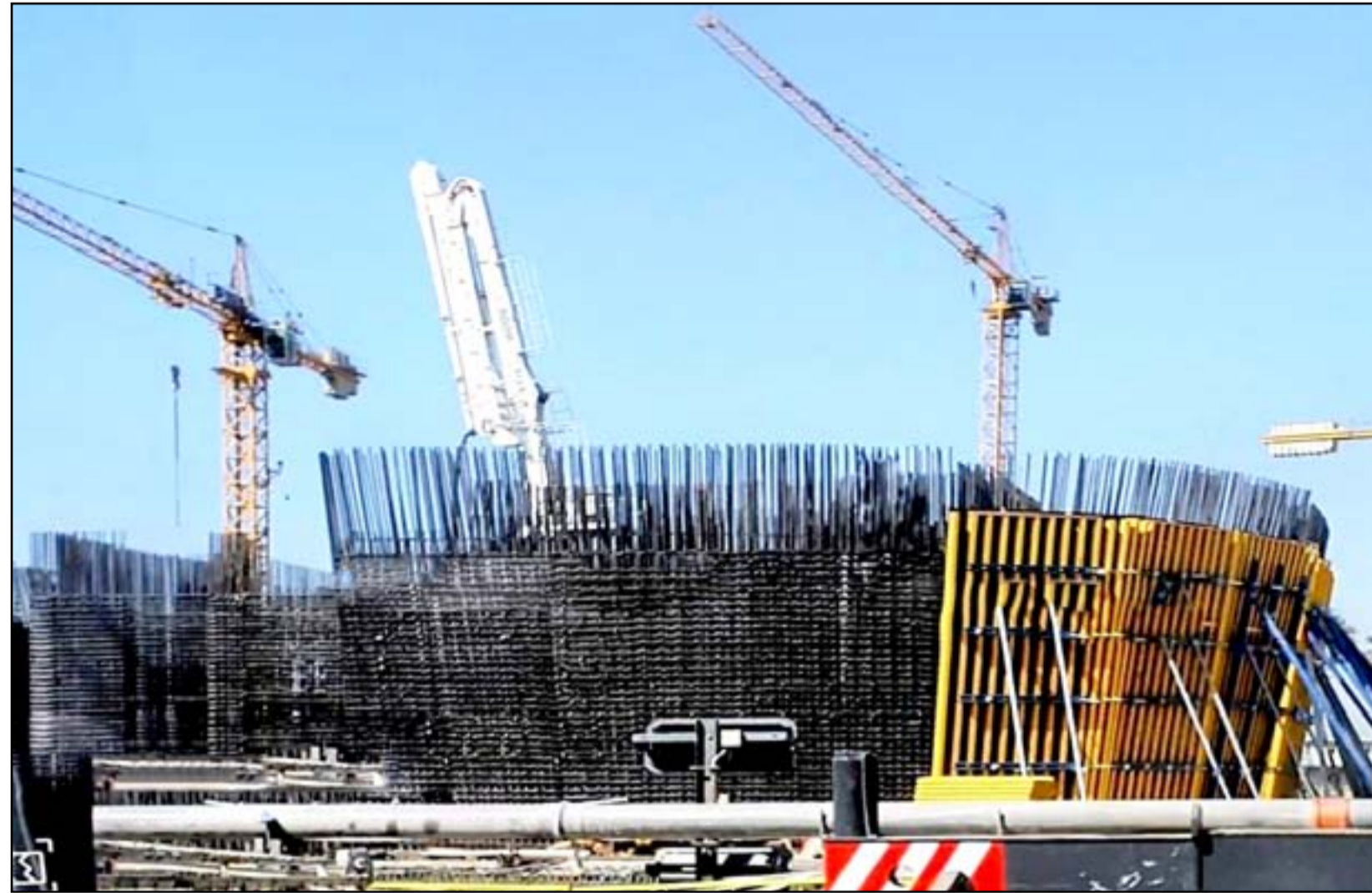
أعمال البناء مستمرة في المبنى الجديد. (أرشيف)

المطلة على نهر دجلة وتحتوي على مرائب لوقوف سيارات الموظفين والضيوف والسيارات الخاصة بنقل العملة، ومطعم، ومتحفاً، وقاعات للاجتماعات، والمؤتمرات، ومسرحاً للاحتفالات. ويتابع النائب عن كتلة الاتحاد الإسلامي الكردستاني أن من بين الأمور التي اتضحت للجنة المصغرة