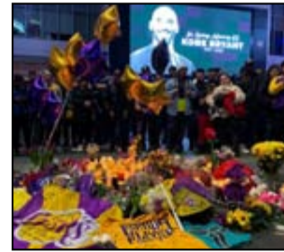
نكزى براينت، حيث كتب الرئيس الأمريكي دونالد ترامب: "كوبي براينت، على الرغم من أنه كان من

نعى العديد من المشاهير حول العالم من فنانين ورياضيين وسياسيين، أسطورة كرة السلة الأميركي كوبي براينت، الذي قُتل في حادثة تحطم طائرة مروحية بكاليفورنيا، أمس الأحد، مع ٨ أشخاص آخرين بينهم ابنته جيانا (١٣ عاماً). وسبب رحيل النجم الفائز بدوري كرة السلة الأميركي ه مرات، عن عمر يناهز ٤١ عاماً، صدمة كبيرة في العالم، قبل ساعات من بدء حفل توزيع جوائز "غرامي"، الذي افتتح بالوقوف دقيقة صمت تكريماً لتكزى براينت، وفقاً لموقع "بي بي سي". وأعلنت المغنية ليزو، قبل أن تؤدي أغنية الافتتاح، "أر حفل" غرامي" عام ٢٠٢٠ مهدي لروح براينت، ثم غنت لتكراه المغنية والملحنة البشبا كايوز، أغنية "من الصعب أن نقول وداعاً لأمس"، بأداء مؤثر برفقة فرقة "يوز تو مين". ونشر العديد من السياسيين، تغريدات كرموا فيها