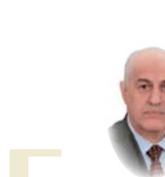
القاضي سالم روضان الموسوي

مستقبله فإنها تسمى حكومة تصريف الأعمال وإن كان ذلك من جراء أزمة دستورية طارئة أو عابرة، إلا أنه يكون أحياناً نتيجة لتجدد طبيعي في نظام الحكم والإدارة مثال على ذلك الفترة التي تلي الانتخابات النيابية ولحين تشكيل الحكومة الجديدة، وخاصة القول إن مجلس النواب عند قبول استقالة رئيس الوزراء وجعل الحكومة حكومة تصريف الأعمال فإنه قد خسر دوره الرقابي على أعمال الحكومة التي تمثل السلطة التنفيذية بحكم مسؤوليتها الدستورية أمام البرلمان وهذا من الأمور التي توجب على رئيس الجمهورية ومجلس النواب بالإسراع في تكليف رئيس الوزراء بتشكيل الحكومة ومنحها الثقة حتى يتسنى لمجلس النواب الذي يفترض فيه ممثل الشعب بممارسة دوره الرقابي والعمل على التكافؤ بين السلطات وعدم جرجان تصرفه سلطة على أخرى، فضلاً عن صريحة بعض النواب بأنهم سيحاسبون الوزراء الذين قاموا بتعيين مدراء عامين أو وكلاء وزراء دون الرجوع إلى البرلمان وإن فعلهم غير دستوري فإن قولهم هذا لا يؤثر ولا يمكن لهم التأثير على الوزراء لأن ليس لهم أي سلطة رقابية كونهم مقالين أو بحكم المستقلين وعلى وفق ما تقدم ذكره.