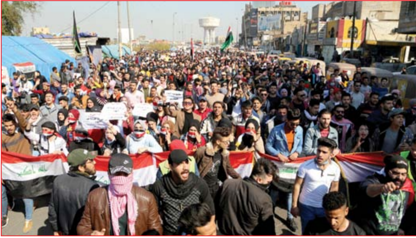
الطالبة يعيدون زخم ساحة التحرير أمس..