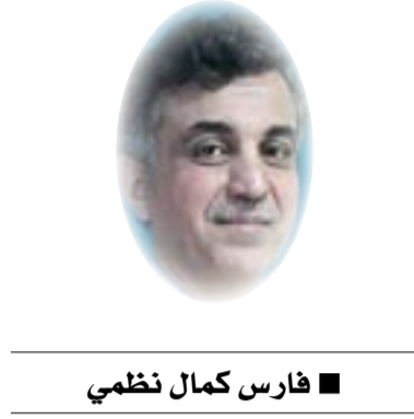
■ فارس كمال نظمي

سلوكه السياسي وإعادةه المجرية إلى مسباته وعناصره، أي فهمه وتفسيره بهدف إبطال غرائبه. إلا أن محدودية السطور الحالية يجعلها تسعى للتركيز على ثيمة سيكوسياسية واحدة دون إنكار أو تجاهل بقية التفسيرات الموازية والمكملة لبعضها. هذه الثيمة لا تقتنع بـ "جوهرانية" أو "تأصيلية" الانقلاب المزاجي في سلوك السيد مقتدى، بل تهتم بالسباق السياسي الوعر الذي وجد نفسه فيه، ما يجعل هذه التقلبات أمراً مفهوماً بوصفها ردود أفعال حادة لمواقف مستجدة صادمة وغير مسبوقة بالنسبة له.