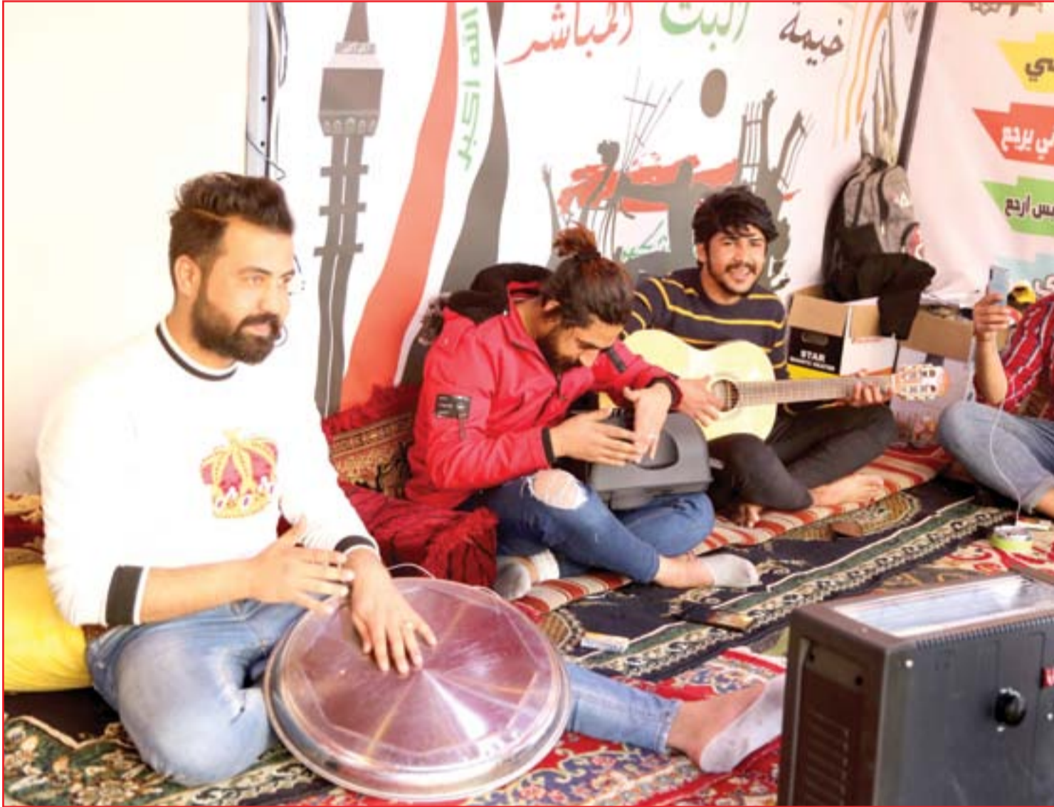
متظاهرون يعزفون في ساحة التحرير..