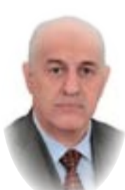
القاضي سالم روضان الموسوي