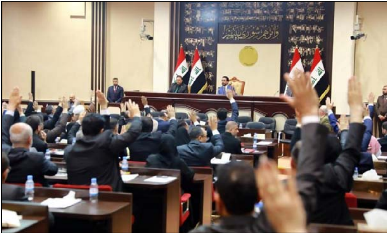
جلسة سابقة لمجلس النواب... ارفشيف

اختيار أعضاء مجلس المفوضين من قضاة ومستشارين لإعادة بنائها ضماناً لنزاهة وشفافية العمليات الانتخابية المقبلة ودعم ركائز الديمقراطية في العراق . وأضاف البيان أن "مجلسها عقد اجتماعه التأسيسي الأول في ١٣/١/٢٠٢٠ لانتخاب رئيس ونائب رئيس مجلس المفوضين والمقرر ورئيس الإدارة الانتخابية، ثم أعقبت تلك سلسلة من الاجتماعات لاتخاذ الإجراءات لتطبيق القانون من خلال إعداد نظام داخلي وهيكل للمفوضية بالتعاون مع وزارة التخطيط لتعزيز وتطوير أداء العاملين فيها استعداداً للاستحقاق الانتخابي المقبل في مختلف مراحله بدءاً من تحديث سجل الناخبين الإلكتروني وتوزيع بطاقة الناخب الإلكترونية البايومترية وصولاً إلى صندوق الاقتراع . وتابع البيان أن "المفوضية العليا المستقلة للانتخابات تسعى إلى إعادة ثقة الجمهور بها وبالعملية الانتخابية من خلال الاستقلالية في الأداء وإجراء إصلاح انتخابي من خلال تحسين مستويات استجابة العمليات الانتخابية لتطلعات وآمال المواطنين وتعزيز مزيد من الحيادية والشفافية والنزاهة والدقة . وصوت مجلس النواب في شهر كانون الأول الماضي على قانون الانتخابات الجديد باستثناء المواد المعنية بالجدول التي تحدد حجم الدوائر الانتخابية . وفي سياق متصل، رفضت المحكمة الدستورية المختصة في شأن الشكوك التي تحول دون عدم قدرتها في تنظيم انتخابات برلمانية مبكرة في ظل الظروف الراهنة . وقالت المحكمة الدستورية باسم مجلس المفوضين جمانة زهير إن "مفوضية الانتخابات تتمتع عن الإجابة أو التواصل مع الصحفيين في الوقت الحاضر، وتتطلب مصادقة مجلسها على قرارات السياسة الإعلامية الجديدة التي تؤسس إلى سياسة مغايرة ومختلفة عما كانت متبعة سابقاً ."