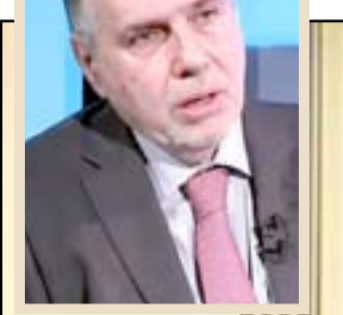
مجلس النواب، معتكداً أن تكليف علاوي جاء مخالفاً لإرادة المحتجين والمرجعية الدينية.

وفي الخامس من شهر شباط الجاري - بعد ايام من تكليف علاوي - كشف ائتلاف دولة القانون (المدى) عن حراك سياسي تقوده اطراف اسماها "قوى الاعتدال" حضر للاطاحة بحكومة محمد توفيق علاوي داخل مجلس النواب، معتقداً أن تكليف علاوي جاء مخالفاً لإرادة المحتجين والمرجعية الدينية.