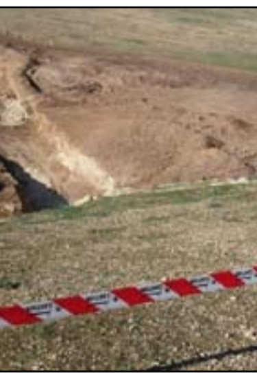
مقبرة تضم رفات أكثر من 1000 مدني غرب الموصل

على يد تنظيم داعش الإرهابي، وبعض الناجين من قبضة التنظيم، لم يعد منهم سوى ما يقارب 40 مختلفاً فقط. وقتل تنظيم داعش الإرهابي، الآلاف من المواطنين العراقيين، ودفنهم في مقابر جماعية، لاسيما عمليات الإيداع التي طبقها بحق أبناء المكون الإيزيدي بعد اقتياد الفتيات، والنساء، سبايا وجاريات، أثناء سطوته على مدن الشمال. واستمرت جرائم تنظيم داعش الإرهابي، بحق المدنيين العراقيين، حتى أثناء هزيمته بتقدم القوات الأمنية لتحرير السكان، والمدن، خلال الأعوام ما بين 2015، وحتى أواخر عام 2017.