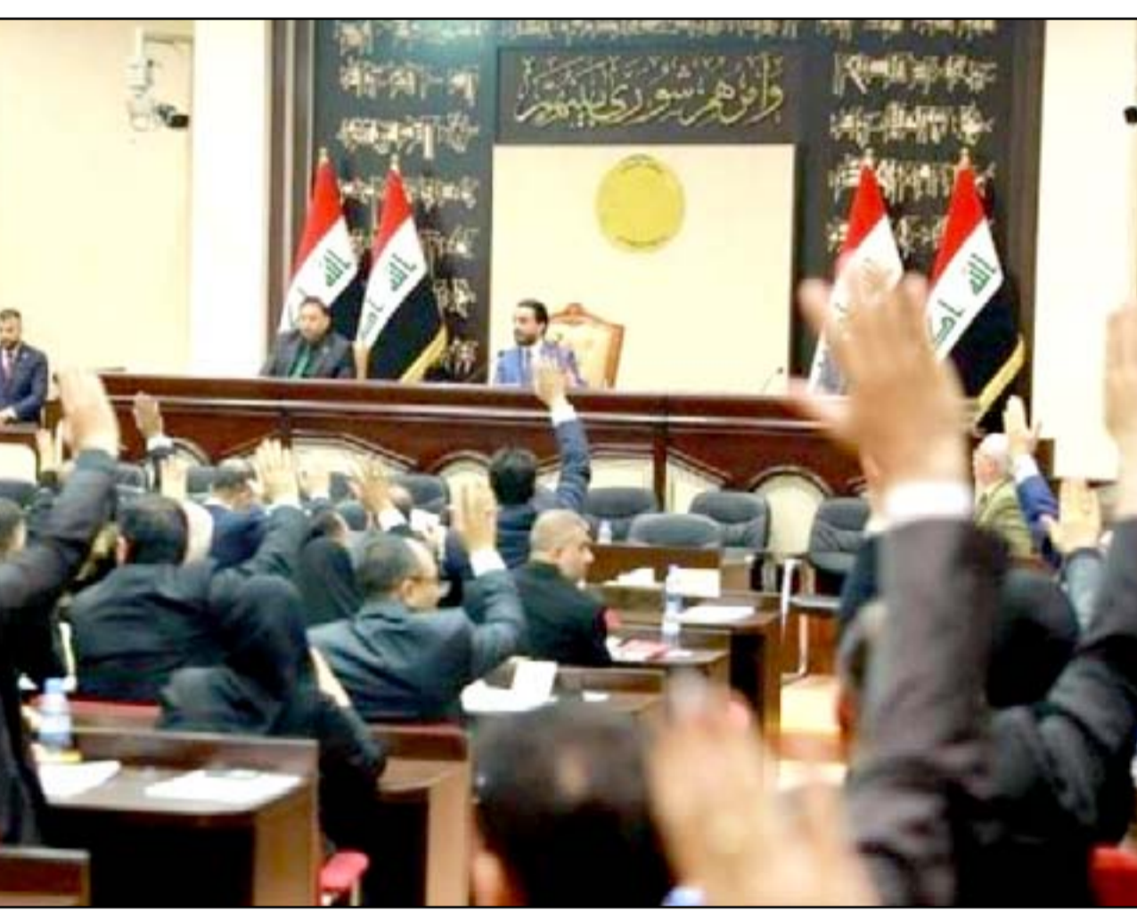
جلسة سابقة لمجلس النواب