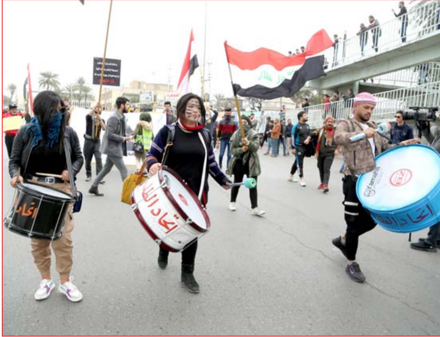
الطلبة يعيدون الزخم لساحات الاحتجاج..

على ما حققته الاسبوع الماضي، من السيطرة على محيط ساحة التحرير، مستخدمة العنف الشديد، ضد من يحاول عرقلة خطتها. واضربت قوات مكافحة الشغب ومسلحون آخرون، مساء اول امس، النار مجدداً في خيم المعتصمين بساحة التحرير بعد نحو