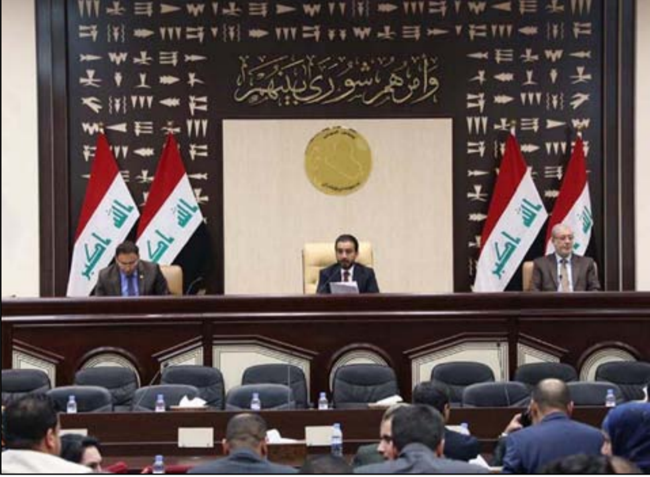
جلسة سابقة لمجلس النواب.. (أرشيف)

إلى هيئة المساءلة والعدالة والجهات المعنية الأخرى الا في حال ضمان عرضها في مجلس النواب، لافتاً إلى أن "تدقيق هذه الأسماء سيكون الخطوة الأخيرة".