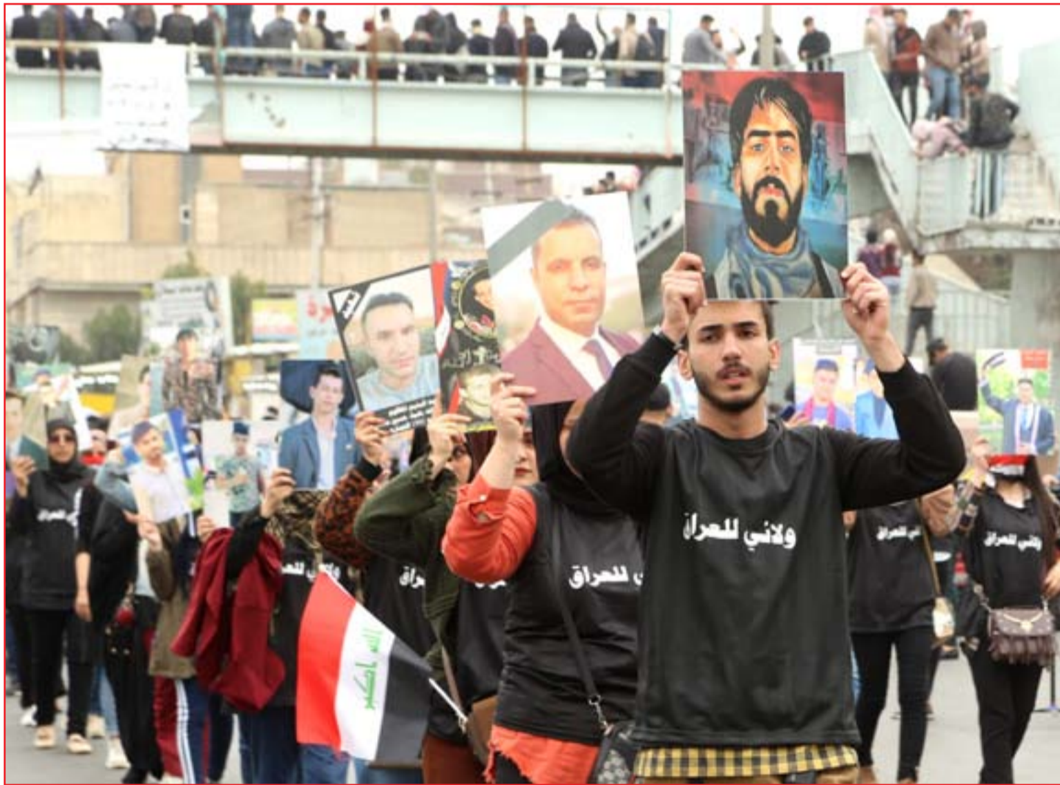
متظاهرون في ساحة التحرير ..

كشفت هيئة النزاهة، أمس الاثنين، عن تنفيذها 41 عملية ضبط في بغداد والمحافظات خلال شهر كانون الثاني الماضي. وقالت دائرة التحقيقات التابعة للهيئة في بيان تلقت (المدى) نسخة منه، إن "مديرياتها ومكاتب التحقيق التابعة لها في بغداد والمحافظات نفذت 41 عملية ضبط، بلغت أرقام الفساد فيها أكثر من (44,000,000,000) مليار دينار"، مبيّنة أن أبرزها عملية ضبط بدالة لاسلكية في مديرية اتصالات وبرىد البصرة تم شراؤها بأكثر من (14,000,000,000) مليار دينار ضمن برنامج تنمية الأقاليم لسنة 2012، وبقيت متروكة في مخازن بريد البصرة، بالرغم من تسلم الشركة المجهزة لمستحقاتها المالية كافة، وضبط الأوليات الخاصة بشراء (64) خزناً (تكررا) بمبلغ (14,000,000,000) مليار دينار لمديرية ماء نينوى". وأضافت الدائرة أن "من بين العمليات ضبط أكثر من مليارات (6,000,000,000) دينار خاصة بالإيرادات المحلية لمجلس محافظة ديالى المنحل التي تم استيفاؤها وجبايتها من (منفذ الصفرة) مودعة في مصرف أهلي خلافا لضوابط وتعليمات وزارة المالية، إضافة إلى ضبط مستندات صرف وصكوك شراء (62) جهازاً طبياً لمستشفيات دائرة صحة المثنى بمبلغ (2,402,000,000) مليار دينار، وضبط كتب صادرة عن مرور صلاح الدين بخصوص صحة صدور سنوات تم تنفيذها بصورة غير رسمية ومخالفة للقانون".