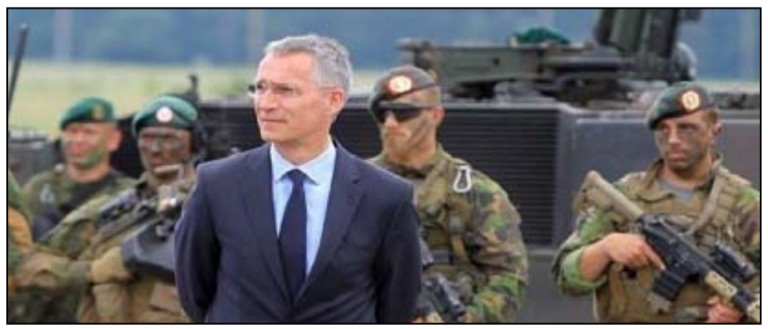
ترجمة / حامد أحمد

مسؤولون عسكريون ذكروا أن "بضع مئات" من القوات قد تغير الأدوار. الخطوة الأولى ستكون في توسيع مهام التدريب في ثلاث قواعد وسط العراق. والخطوة الثانية ربما ستكون في الصيف والتي قد تشهد تغييراً في تفويض المهمة لتشتمل على أنشطة أكثر مما يتولاهما التحالف حالياً.