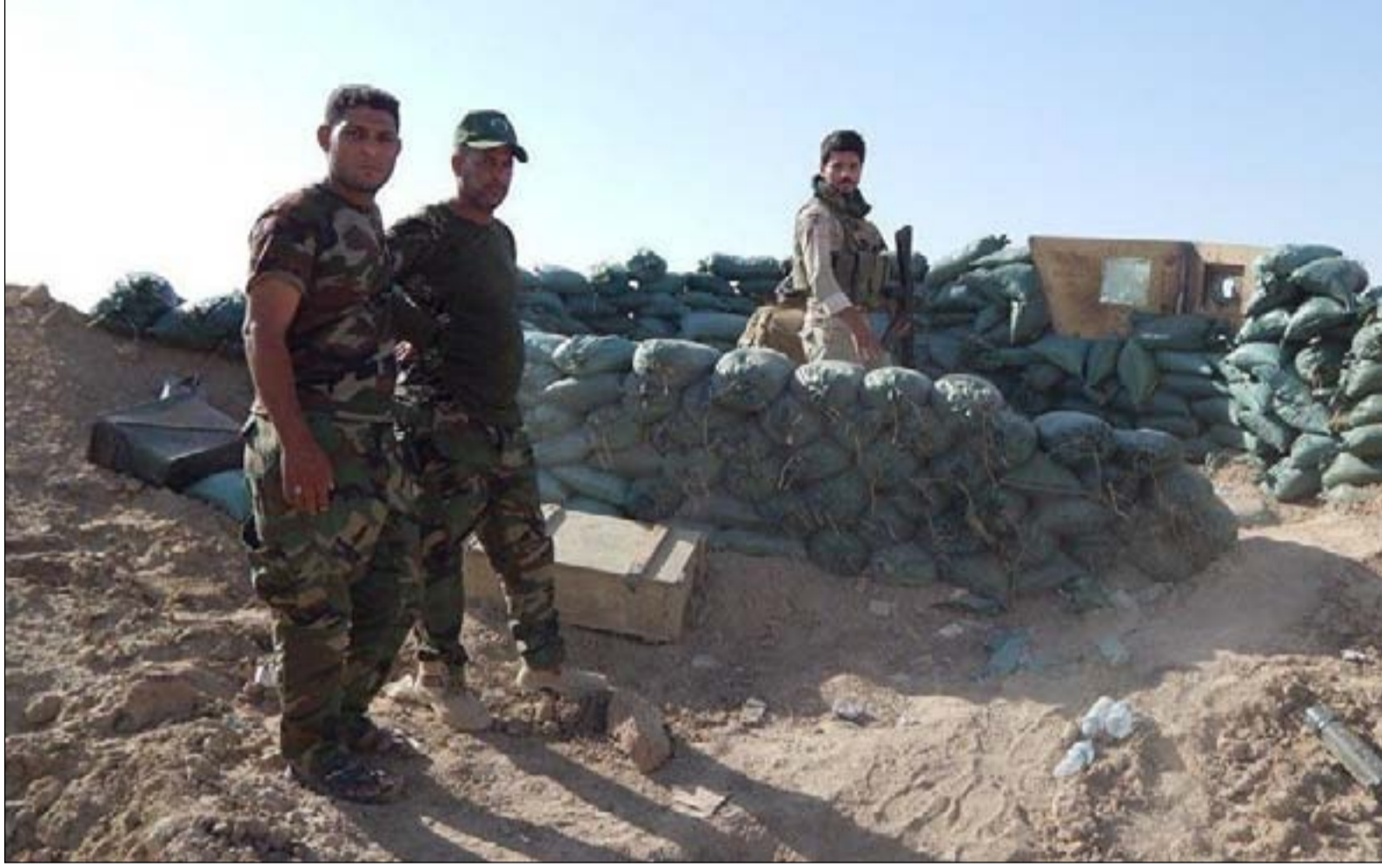
قوة من الحشد غرب تلغفر.. أرشيف

وقبل أسبوع، أقام "داعش" حاجزاً وهمياً قرب عقوبة (مركز محافظة ديالى)، واختطف 7 مدنيين. ويقول المسؤول الأمني: "داعش" يستغل الخلاف على توزيع المهام العسكرية في أطراف المدن، وعدم الاتفاق بين الحكومة الاتحادية والبشمركة (بعد أحداث أكتوبر 2017) لمسك بعض المناطق".