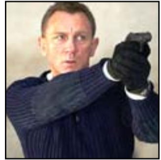
"Time to Die" (لا وقت للموت)، في دور السينما البريطانية، يوم ٣

نيسان المقبل، وهو آخر أفلام الممثل البريطاني، دانييل كريغ، في شخصية "بوند". ومن المتوقع أن يكون الفيلم هو الأكثر تحقيقاً لأرباح شباك التذاكر، في تاريخ أفلام جيمس بوند، ولكن أصبح هذا غير مرجح حدوثه في الوقت الحالي، بسبب تأثر السينما الصينية بفيروس "كورونا"، إذ تمتلك الصين ثاني أكبر شركة في العالم في شبك التذاكر، وبلغت إيراداتها أكثر من ٦ مليارات جنيه إسترليني في العام الماضي.