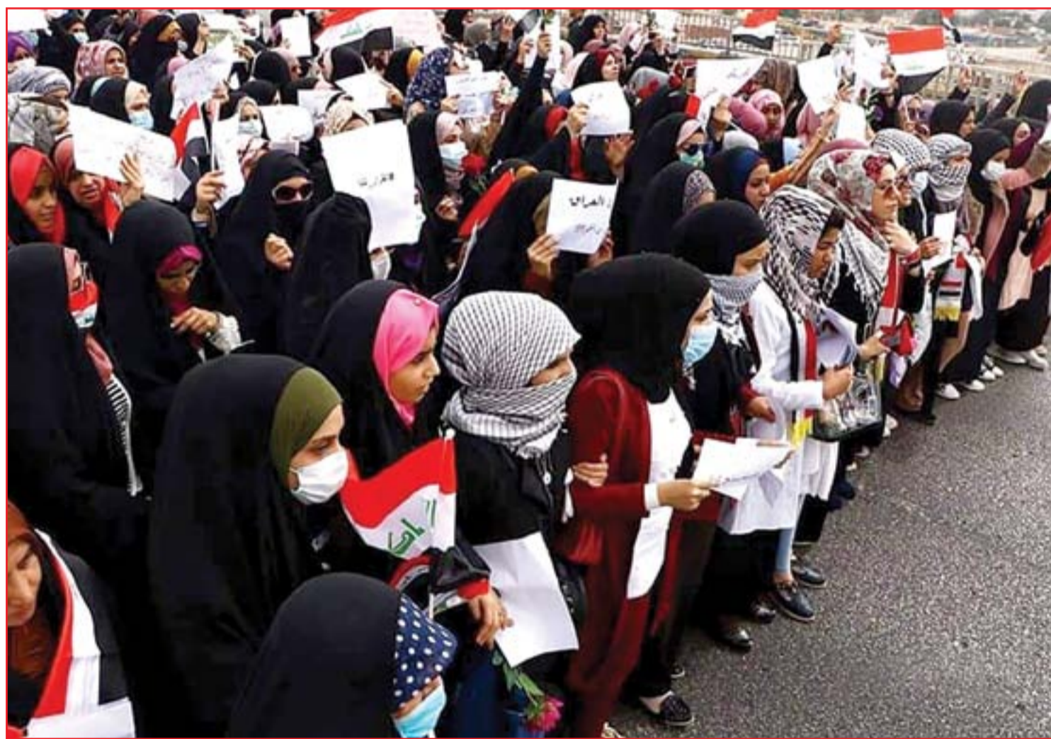
تظاهرة نسوية كبيرة في النجف لأول مرة منذ انطلاق الاحتجاجات

7 مهرجان الجونة السينمائي يعلن عن موعد انعقاد دورته الرابعة