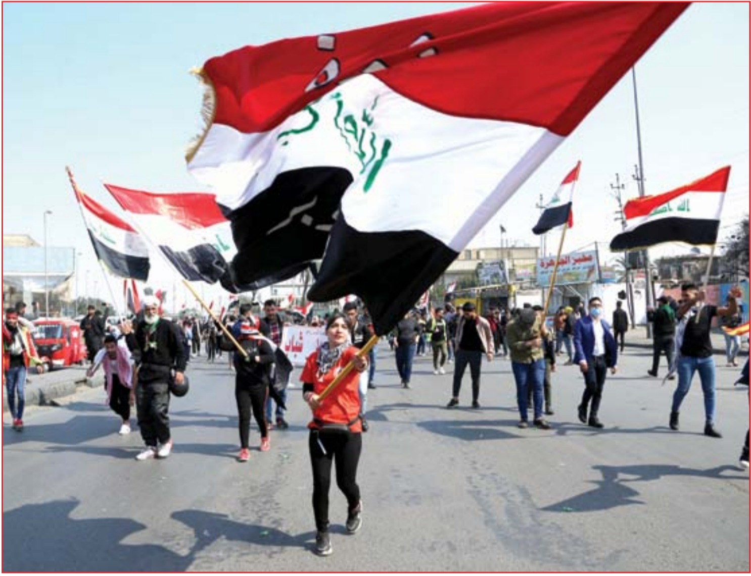
الطلبة يتعهدون بالبقاء في الساحات لحين تحقيق المطالب..

هونغ كونغ وكامبوديا وايران ايام ٣١ آذار و ٤ و ٩ حزيران المقبلين ضمن الجولات الثالثة من مرحلة الاياب بالدور الثاني في التصفيات الآسيوية المشتركة ببطولة كأس العالم لكرة القدم ٢٠٢٢ وكأس آسيا لكرة القدم ٢٠٢٣.