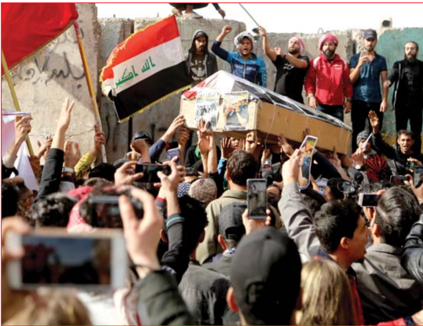
تشبيح رمزي لأخر شهيد في ساحة الخالاني..

أعلن النائب محمد شياع السوداني ان لجنة دراسة منهاج حكومة محمد توفيق علاوي وضعت ملاحظات حول بعض البنود. والسوداني هو احد مرشحي الكتل المنصب رئاسة الحكومة فشل تكليفه بسبب رفض المحتجين. وقال السوداني في بيان نشره على صفحته في (فيسبوك) إن "لجنة دراسة المنهاج الوزاري ستعقد اجتماعاً ثانياً لإكمال تقرير البرنامج الحكومي وإرسال نسختين لمجلس النواب للتصويت عليه في جلسة منح الثقة (اليوم) الخميس". وأضاف أن "اللجنة وضعت جملة من الملاحظات حول بعض البنود التي وردت في المنهاج الوزاري فيما تم التأكيد على تثبيت الأمن والاستقرار في العراق وإكمال متطلبات العملية الانتخابية من أمور لوجستية وتخصيصات مالية لإجراء انتخابات مبكرة". وأشار إلى أن "اللجنة تدرس المنهاج الحكومي بصورة مهنية بعيداً عن أي خلفيات سياسية كما ابتعدت عن أي تجاذبات". ولتت النائب عن ائتلاف دولة القانون إلى أن "المنهاج الحكومي للرئيس المكلف تضمن خطوطاً عامة فيما سيتم إعداد برنامج تفصيلي بعد منح الثقة ومباشرة الوزراء". وجاء البرنامج في ٩ صفحات فقط، وهو يعكس برنامج رئيس الوزراء المستقيل عادل عبد المهدي، الذي كان في ١٢١ صفحة، بالإضافة إلى الملحق. التفاصيل ص ٢