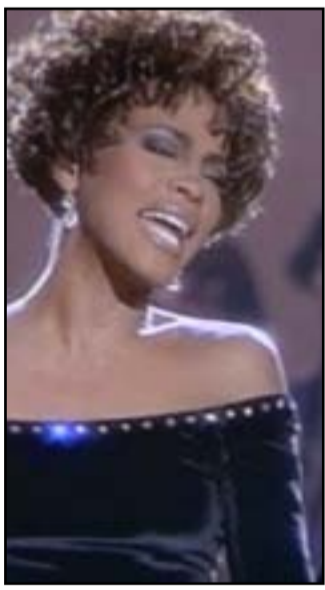
المناسب لهذه الجولة، وإنه "بروح ويتني". في حين أن معظم المعجبين بهيوستون غارقون في حقيقة أنهم يمكنهم مشاهدة مغنيتهم المفضل وهم يؤدون مرة أخرى.