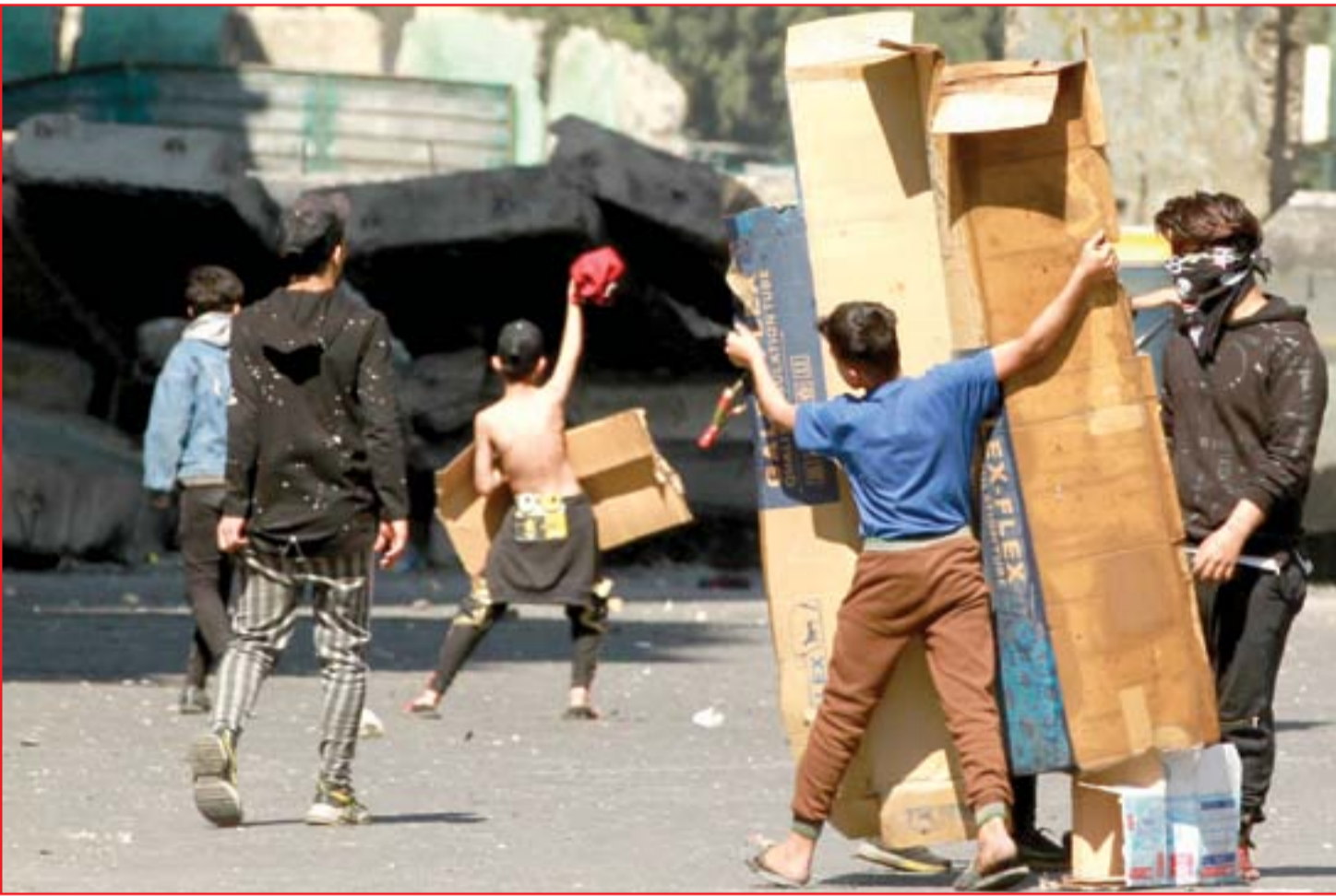
مظاهرون وسط القنابل الدخانية في ساحة الخالتي..