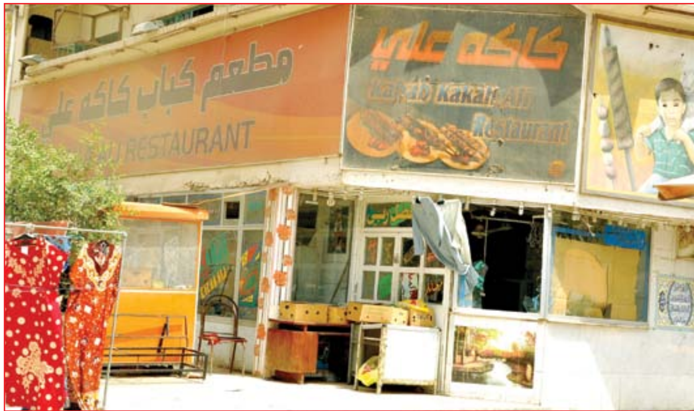
أغلب المطاعم تغلق ابوابها تجنباً لانتشار فيروس كورونا..

كشف وزير الصحة جعفر علاوي، أمس السبت، عدم وجود امكانية لمواجهة فيروس كورونا في حال انتشاره ببقية الدول، مبينا اننا نعالج المصابين بحبوب تجريبية اثبتت نجاحها، مؤكداً