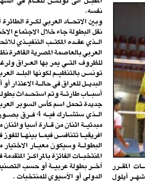
ومن جهة أخرى قرر المكتب التنفيذي للبطولة العربية للمنتخبات المقرر للاتحاد العربي لكرة الطائرة نقل أقامتها في العراق خلال شهر أيلول

المقبل الى تونس لتقام في الشهر نفسه. وبين الاتصاد العربي لكرة الطائرة أن نقل البطولة جاء خلال الاجتماع الاخير الذي عقده المكتب التنفيذي للاتحاد العربي بالعاصمة المصرية القاهرة نظراً للظروف التي يمر بها العراق ولرغبة تونس بالتنظيم لكونها البلد العربي البديل للعراق في حالة الاعتذار أو أي أسباب طارئة وتم استحداث بطولة جديدة تحمل اسم كأس السوبر العربي الذي ستشارك فيه 4 فرق بصورة ميدانية اثنان من قارة آسيا واثنان من افريقيا تتنافس فيما بينها للفرز في البطولة ويكون معيار الاختيار من المنتخبات الفائزة بالمرکز المتقدمة في آخر بطولة عربية أو حسب التصنيف الدولي أو الآسيوي للمنتخبات .