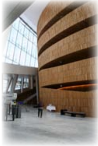
مبنى "دار اوبرا اوسلو" (2008)، المعمار: "مكتب سنوهيتا". منظر داخلي

الهنديسي الواضح وكأنها "جبل جليدي" <إيسبيرغ> Iceberg يبرز من جوف البحر! في الحل التكويني لمبنى الاوبرا نشاهد، أيضا، حضوراً بين إحدى التسهيلات معمارية المكتب، التي باتت جزءاً من "بيرتوراهم" التصميمي، القاضي بعدم الاكتراث مع ممارسة تصميم مبنى بواجهاته الاربعة، ففي مبنى الاوبرا يخفي مفهوم الواجهة التقليدية كعنصر أساس للحل التصميمي، وتنفذ تلك الواجهة ترائينتها أيضاً. إذ ليس هنا في الاوبرا من واجهة رئيسية أو أخرى جانبية "أو خلفية"، جميع الواجهات، بضمنها "الواجهة الخامسة" (وهي واجهة السطح)، معنية في الاشتغال بتوليد "موتيف" المعالجة التصميمية لمبنى الاوبرا! بل ويذهب معماريو مكتب سنوهيتا بعيداً في محاولاتهم لتغيير المفاهيم العادية في العمارة المتجرحة؛ جاعلين من "سطوح" المبنى المتعددة "نصّات" فسحة تسمح برؤية بانورامية للمدينة من جهة البحر. إذ اجاز القرار التصميمي لزواري الاوبرا أن "يتجولوا" بحرية على سطوحها المنحدرة، التي باتت تحاكي ما يشبه "المرابي" Ramps الهائلة العاملة كمشرفات رحيبة في الاطلاع على مناظر احياء المدينة المجاورة