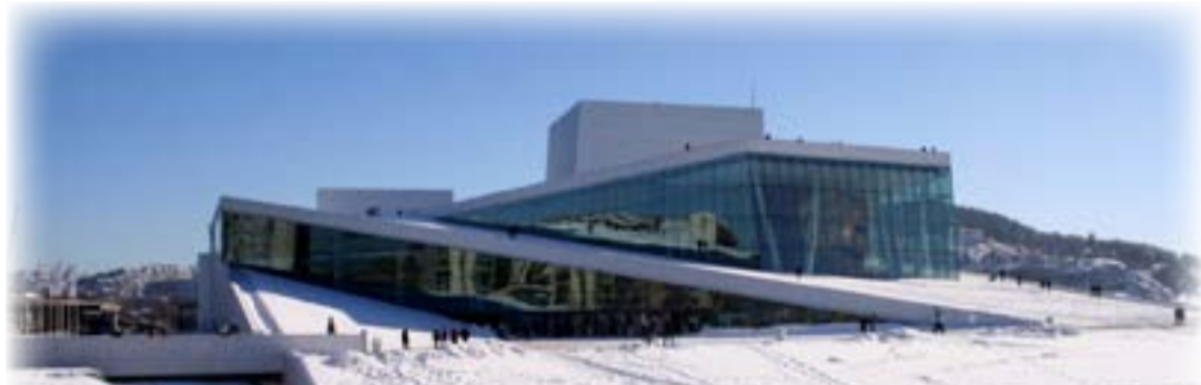
مبنى "دار اوبرا اوسلو" (2008)، المعمار: "مكتب سنوهيتا". منظر عام.

الأولى في 2017-2018، وبعد أكبر معرض لأعمال الفنان الإماراتي الراحل، بما يغطي أعماله منذ بداية السبعينيات وصولاً إلى سنة وفاته في 2016. وتأتي هذه الاستعادة نتوججا لتاريخه الطويل والحاضر في إمارة الشارقة، حيث يعرض 150 عملاً تشمل ممارسته الفنية المتنوعة، بما في ذلك الرسوم الكاريكاتورية الأولى المنشورة في الصحف، ورسومات القصص المصورة