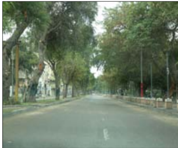
محلات لصناعة الكمامات وتنظيف الشوارع أثناء حظر التجوال...