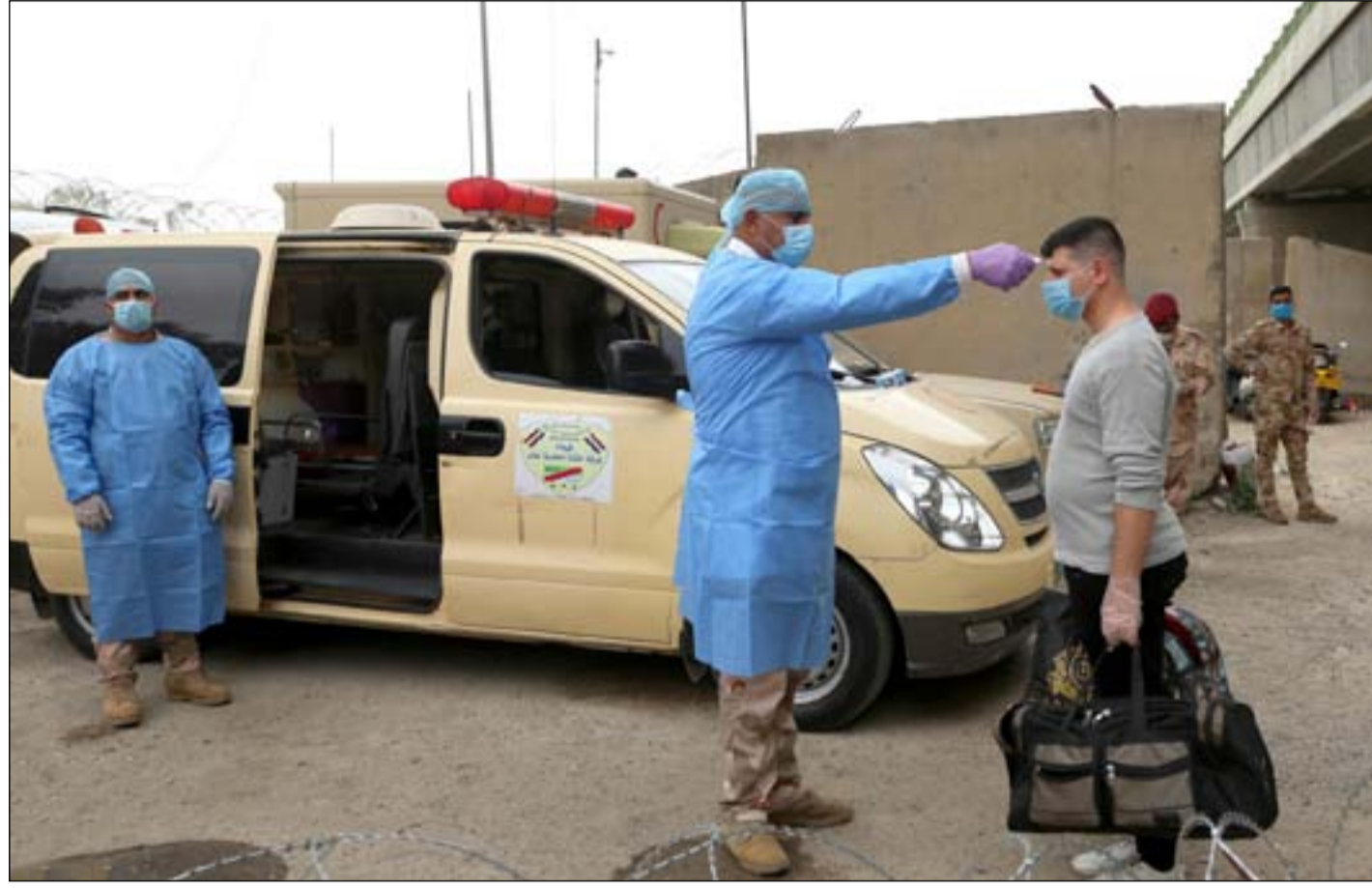
مفارز لفحص الجنود قبل التحاقهم ...

والقضاء عليها اضافة الى تدريب القوات المسلحة من قبل قوات التحالف الدولي لتطوير قدراتها". كما أكد رئيس أركان الجيش "اتخاذ كافة التدابير الوقائية لقواتنا المسلحة والتي ادت للحفاظ عليها من جائحة كورونا وعدم وجود اصابات فيها".