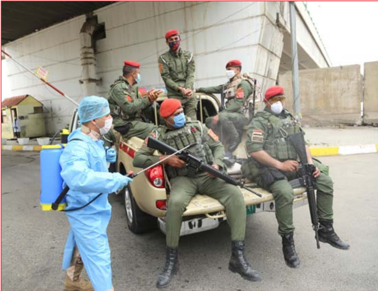
فرق التعفير تنتشر في مناطق بغداد..