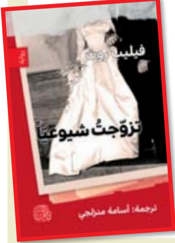
ترجمة: سام فاهمي

عن دار المدى، صدرت الترجمة العربية لرواية الكاتب الأميركي الشهير فيليب روث "تزوجت شيوعياً"، التي يصور فيها دمار رجل ناجح بفعل تواطؤ زوجته مع الكاثوليك الذين أثاروا مناخاً إرهابياً سمح لهم بمطاردة الشيوعيين والمتعاطفين معهم في الوسطين الأدبي والسينمائي. أراد روث أن يقول إن أميركا غير المتسامحة، أميركا الشمولية، تحارب الشر بشرّ مماثل. روث واحد من أهم الكتاب في الولايات المتحدة في جيله؛ حصل مرتين على جائزة الكتاب الوطني، ومرتين على جائزة النقاد الوطنية للكتاب، وثلاث مرات على جائزة فولكر، كما حصل على جائزة بوليتزر للعام 1997.