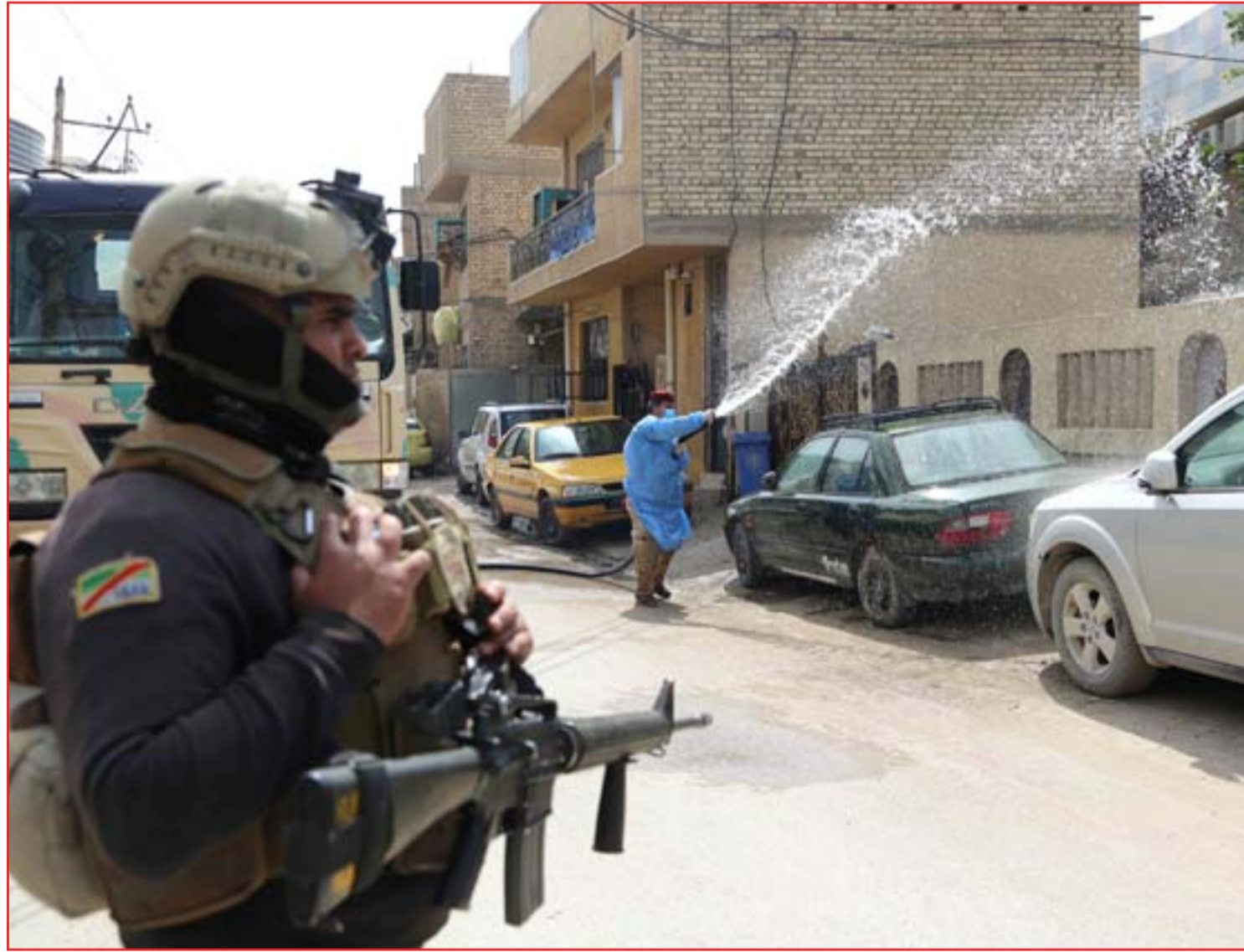
الجيش يواصل عمليات التعقيم في الأحياء السكنية .. (عسة: محمود رؤوف)