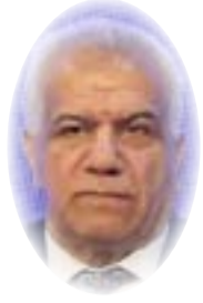
د. حسين الهداوي

كنت في مطلع السنة الثانية بقسم الفلسفة في كلية الآداب بجامعة بغداد، عندما وقف أمامنا ظهيرة ذلك اليوم من نهاية ايلول 1967، استاذنا الجديد الدكتور حسام محي الدين الألوسي القادم لثمن بريطانيا بعد أن حصل من جامعة كامبردج في عام 1966 على شهادة الدكتوراه في الفلسفة عن أطروحته "مشكلة الخلق في الفكر الإسلامي" وتحت إشراف المستشرق الألماني الشهير ارفن روزنتال 1991 - 1904 Erwin Rosenthal.