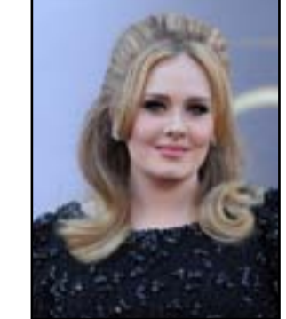
مشاهدة على اليوتيوب، فيما حققت أغنية hello الشهيرة للمطربة العالمية Adele أكثر

من ٢ مليار ٦٣٧ مليون مشاهدة منذ طرحها في تشرين الأول عام ٢٠١٥. آديل كانت فجرت مفاجأة هزت بها الوسط الفني، حيث صرحت بأنها كانت قد أصيب بالتهاب شديد عندما كانت في إحدى جولاتها الغنائية، وأجرت عملية جراحية دقيقة جدا في حنجرتها كادت تؤدي بمستقبلها الفني، إلا أن النتائج جاءت عكسية تماما، وشهدت آديل تحولا غريباً في صوتها، حيث ازدادت نغمات عن مستوى صوتها الطبيعي، وحولته إلى صوت جديد كأنه لم يستهلك أبدا.