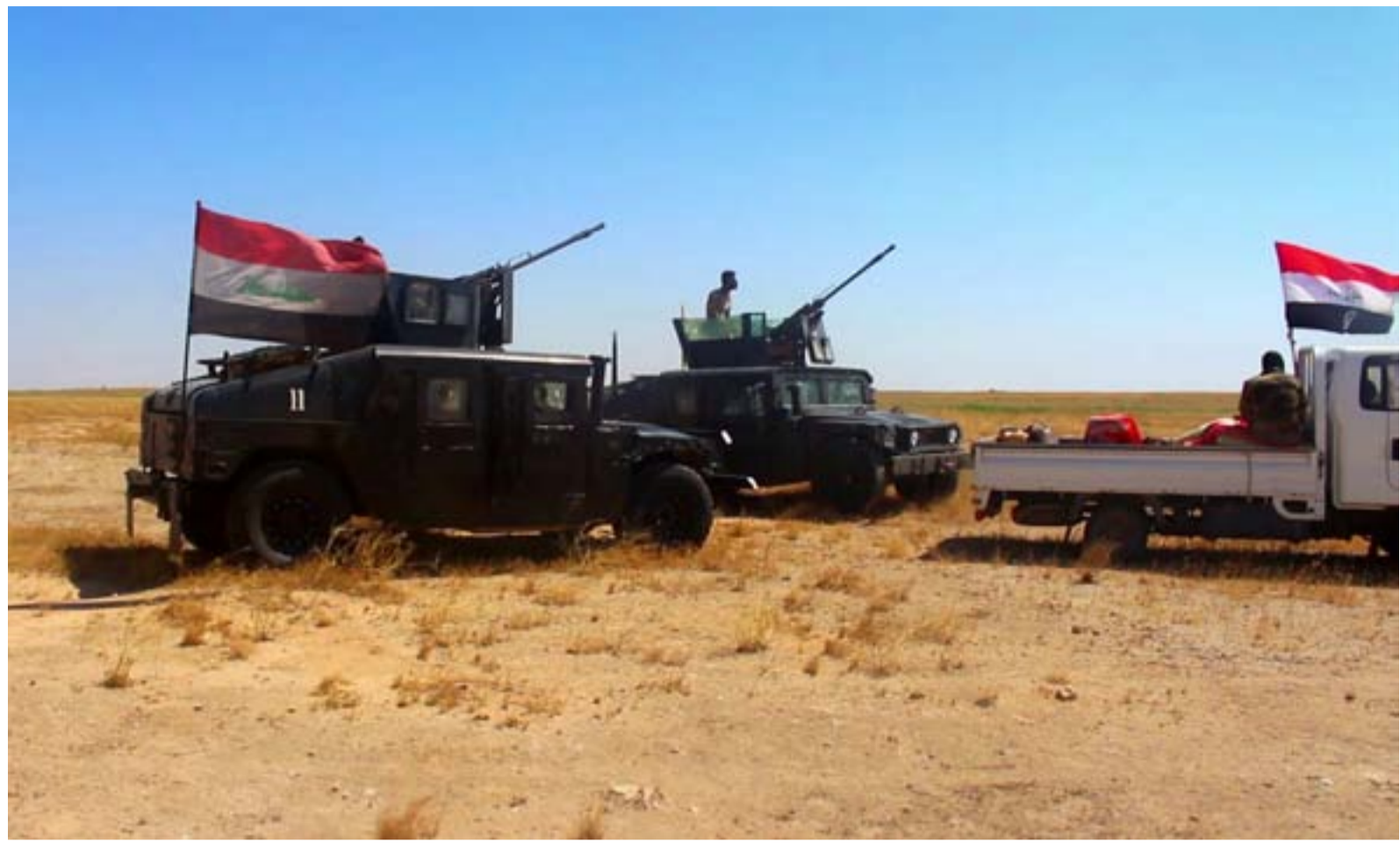
قوة عسكرية شمال سامراء... ارشيف

ومنذ تلك اللحظة، بدأت العمليات تتصاعد، مع سحب عدد من الدول الأعضاء في التحالف، وإيقاف برامج