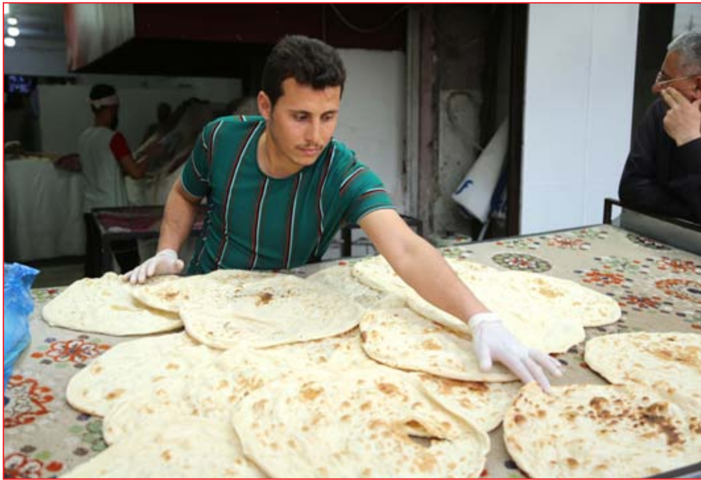
أفران توزع الخبز على المحتاجين مجاناً...