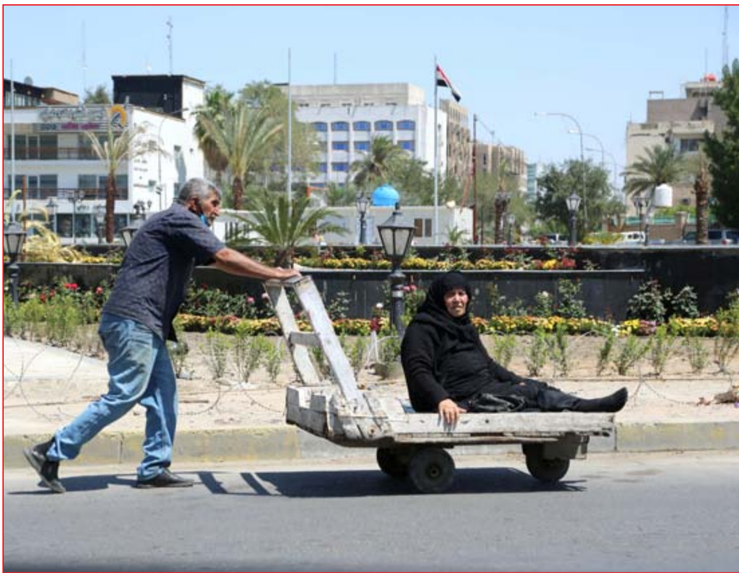
البغداديون يعتمدون على طرق بدائية في التنقل...