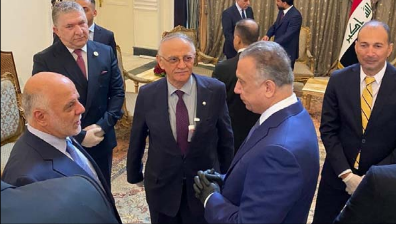
الكاظمي خلال جلسة تكليفه

وأعلن يوم الجمعة الماضي انطلقت المفاوضات بين رئيس مجلس الوزراء المكلف مصطفى الكاظمي والكتل السياسية بشأن وضع آلية محددة لاختيار الطاقم الوزاري والبرنامج الحكومي على امل إرسالها إلى البرلمان ضمن التوقيعات الدستورية. ويؤكد الفايز أن "تشكيلة الحكومة لم تكتمل بشكلها النهائي لكن لمفاوضات تجري بطريق سلسة وسهلة جداً، ولم تواجه أية صعوبات أو عقبات، وبالتالي إن هذا الأمر سيساعد المكلف على تقديم كابينته الحكومية