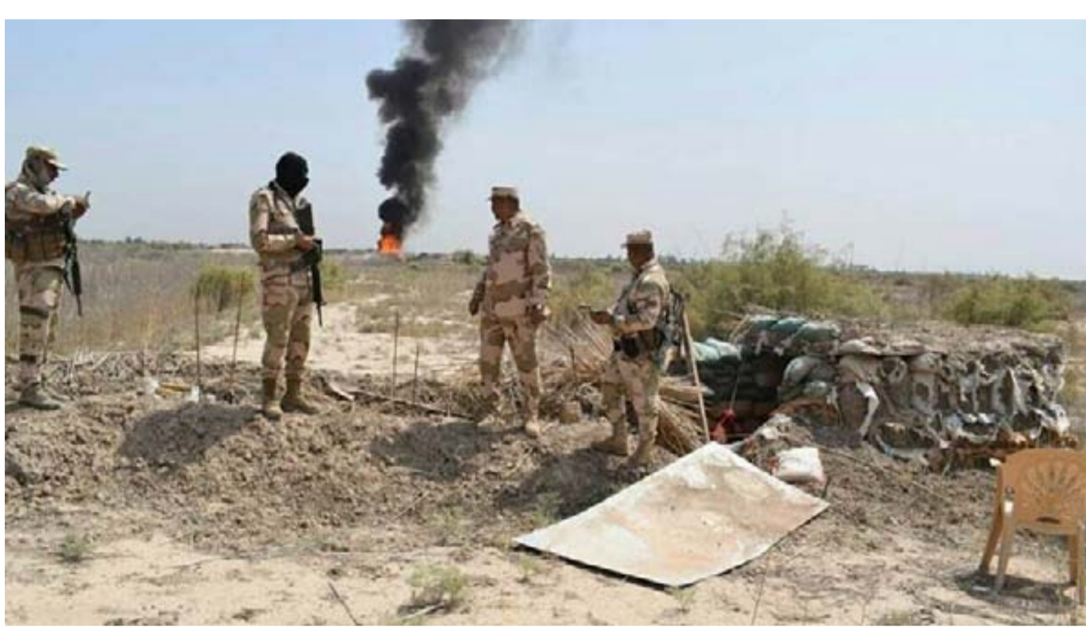
قوة من الجيش شمال صلاح الدين

بعد أكثر من ٢٠ هجوماً وعشرات القتلى والجرحى، في مناطق شمال بغداد، اعترفت وزارة الدفاع بأن هناك تصاعداً في العمليات المسلحة وحالات "تسلل" لمسلحين من تنظيم داعش. وتؤكد مصادر أمنية في تلك المناطق، صعوبة القضاء على خلايا داعش التي نشطت مؤخراً، بدون مساعدة دولية. بالإضافة إلى وجود عصابات فنية في تعقب ما تبقى من التنظيم بسبب غياب التنسيق بين المقاتلين المحليين في تلك المناطق، والقوات العسكرية المختلفة.