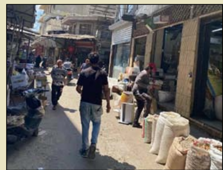
عادت الحياة مجدداً إلى سوق يعود إلى ثالث خلافة في تاريخ الإسلام، في قلب العاصمة بغداد، بعد إغلاق دام أسابيع إثر الحظر الوقائي المفروض في عموم البلاد، ضد تفشي فيروس كورونا المستجد.

غير المتوفرة في باقي الأسواق الشعبية، عاود العمل، في ظل الحظر الوقائي الذي تبأيت أنباء انتهائه الأحد المقبل.