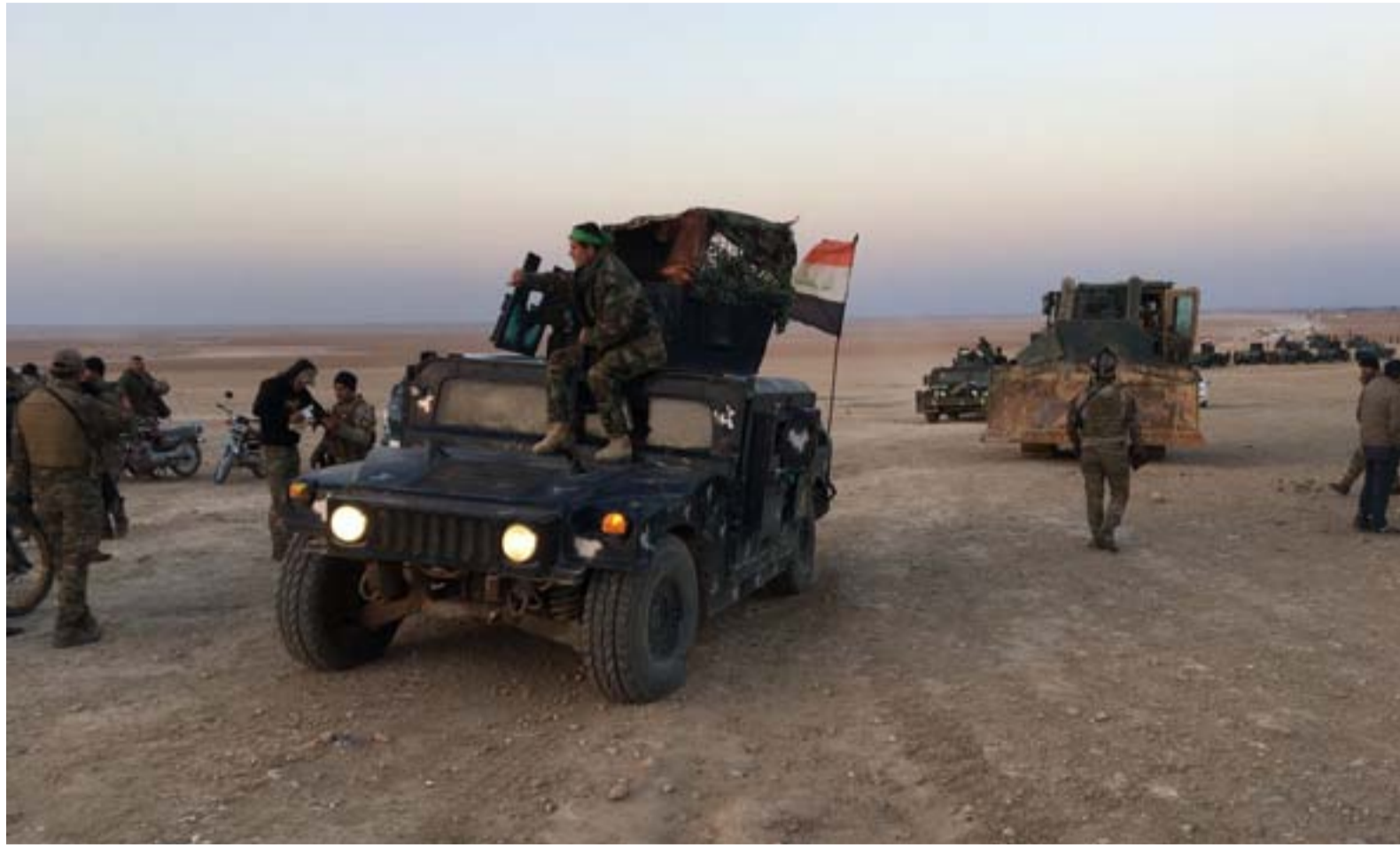
قوة عسكرية غرب صلاح الدين

المقابل قال وزير الدفاع نجاح الشمري خلال ثقافته المديرية العامة