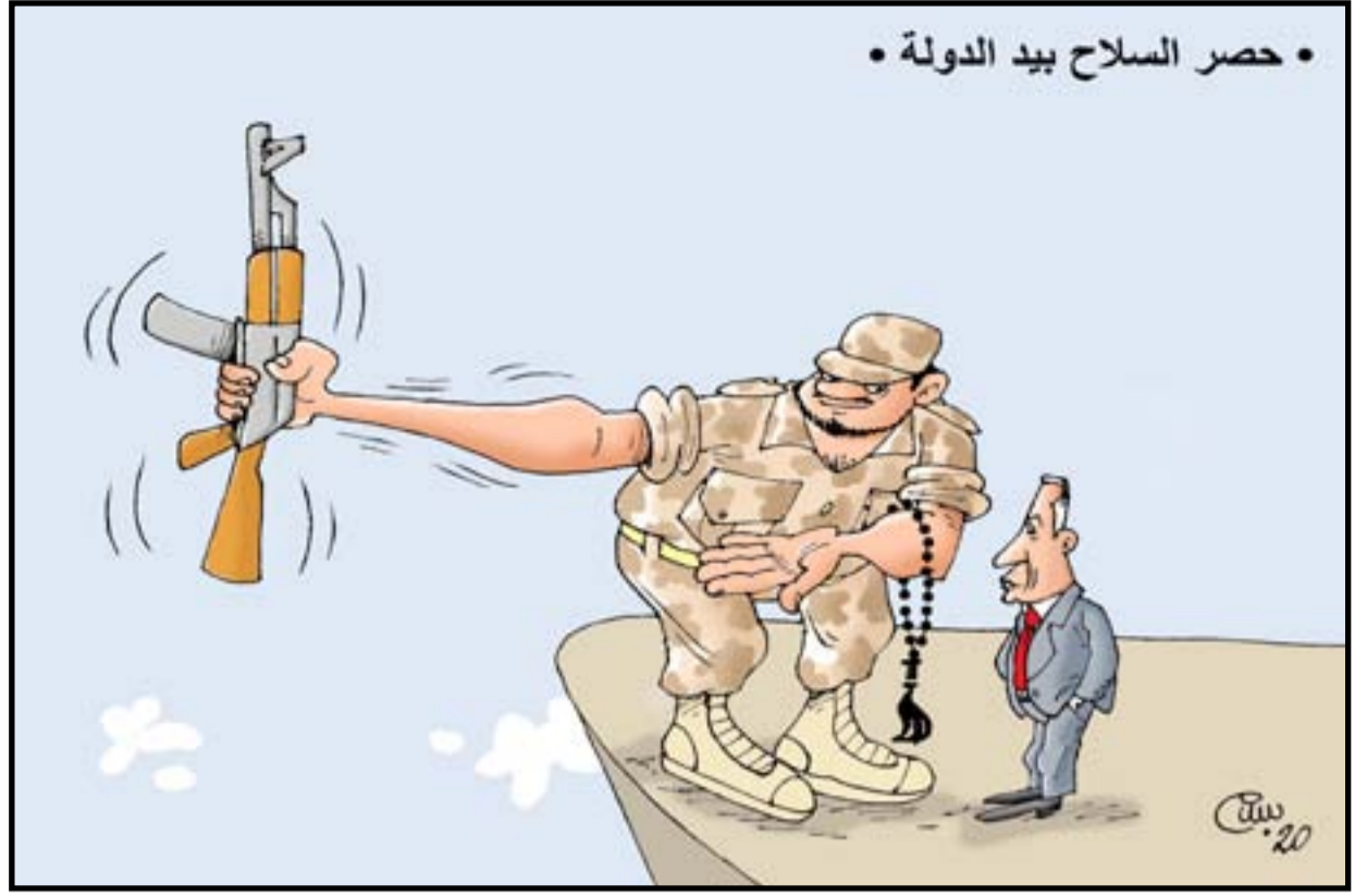
حصار السلاح بيد الدولة