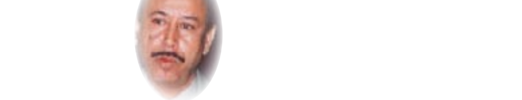
■ د. قاسم حسين صالح

خلوهم من الفاسدين ولسان حالهم يقول (انتخبه وانتخبه ما دام شيعي.. حتى لو كان فاسداً). بالقابل، حصل للجماهير الشيعية من السنة الذين استلموا السلطة سيفعلون بهم ما فعلت بهم السلطة السنة طوال حكمها للعراق. فضلاً عن أنهم شعروا بالغين السياسي والإحباط الذي يصل نزوته في ظروف الأزمات فيؤدي إلى العدوان، وهذه حقيقة نفسية تحدث عند إعاقة جماعة عن تحقيق أهداف تراها مشروعة ولا تجد وسيلة أخرى لبلوغها غير العنف. ومع أن صدام ارتكب الفضائح بحق الوطن "تدمير ثروة العراق الهائلة" وبحق الكرد والشيعاء وحتى أقرب الناس إليه، فإن مشهد إعدامه أساء العدالة التفتيشية وافترق إلى شجاعة وخلق المظلوم حين يترجم من الظالم، وأثار تعاطفاً انفعالياً اختزل للرجل الكثير مما يحسب عليه، وجعل مناسبة العيد (أعدم فجر أول أيام عيد الأضحى بحساب السعودية وسنة العراق) عبيدين لطائفة وفاجعتين للطائفة الأخرى. والأخطر أن مشهد الشفوي وما فاج به من رائحة طائفية وإعلان صريح ليضعها أمام أبواب الحقائق، فزادت الواقعة من العراق والعالم العربي، فكان ما كان مما حصل ويحصل الآن. هل تعلمنا درس؟.. هل سنستخلص من ارتكابنا أفعالا لا نستوعبها مفردات اللغة وصف بشاعتها ولا عقلائيته؟.. هل سينتبه رئيس الوزراء المكلف السيد مصطفى الكاظمي لما أحدثته السلطة سيكولوجيا في تشكيلته الشخصية العراقية.. ويعاقبها ليضمن أقوى دعم له في نجاحه.. ما ستشهد (2020).. هو.. اليقين.