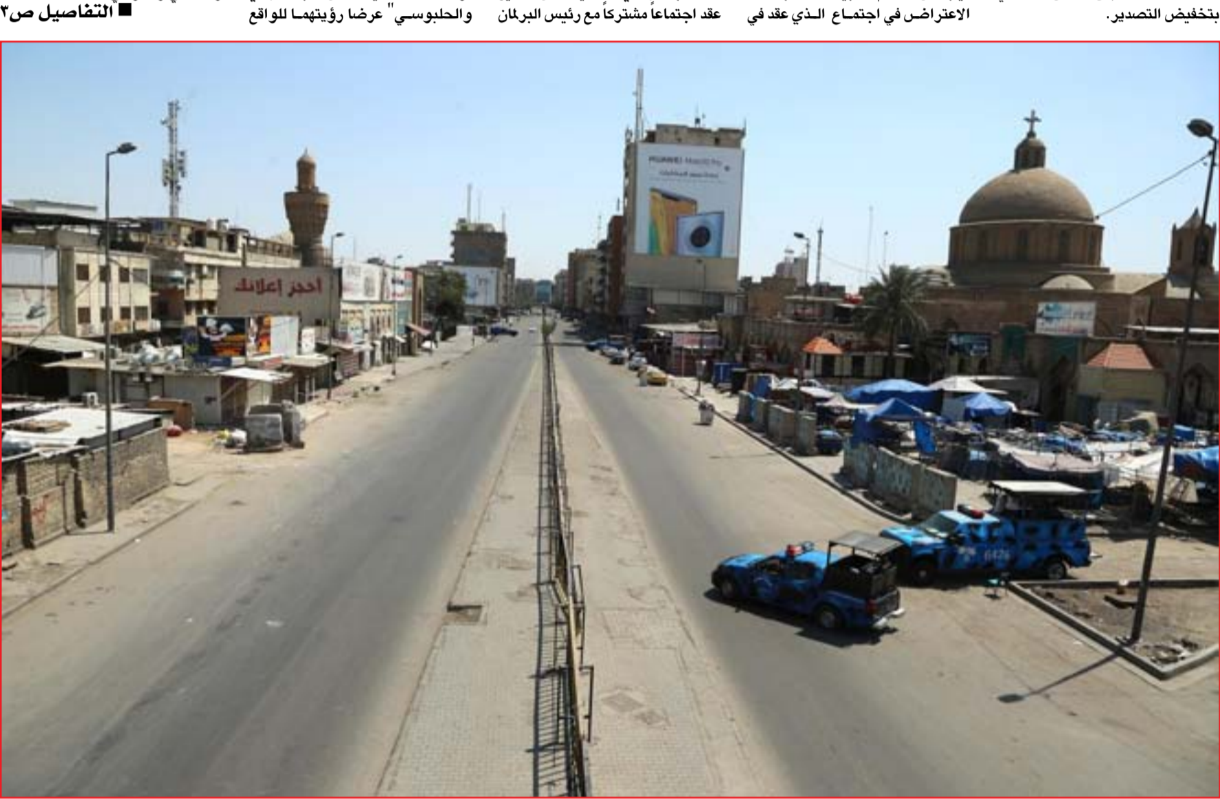
مركز العاصمة بغداد في ظل حظر التجوال...

محمد الحلبوسي برفقة عدد من الوزراء والنواب لمناقشة عدد من القضايا بينها الانفاق الحكومي واسعار النفط، وجاءت كورنا. وذكر بيان صادر من مكتب عبد المهدي اول امس الخميس، ان "عبد المهدي والحلبوسي" عرضا رؤيتهما للواقع