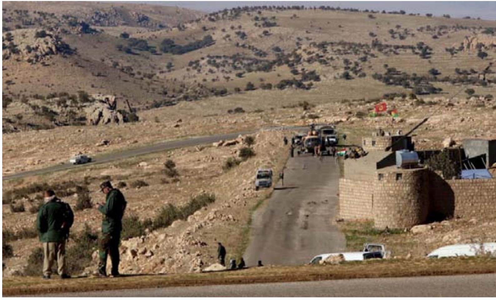
مقاتلون قرب جبل سنجار

وقال مسؤول ايزيدي في سنجار شمال الموصل، في اتصال مع (المدى) امس: "نخشى ان تتسبب تلك الهجمات الموجهة ضد المعارضة التركية في العراق (بي كي كي) بفتح المجال امام داعش للتحرك".