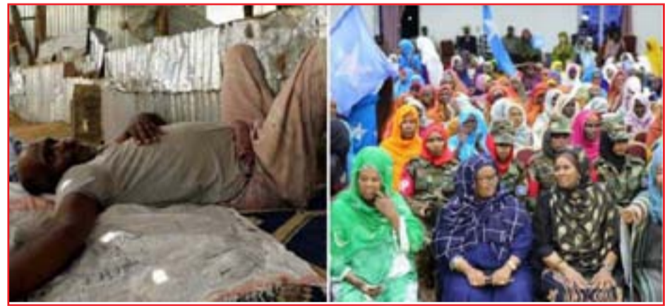
تقول فرح لوكاله "رويترز": "بعد حرمانه من القات، أضحي زوجي